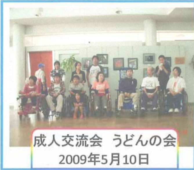
成人交流会 うどんの会 2009年5月10日