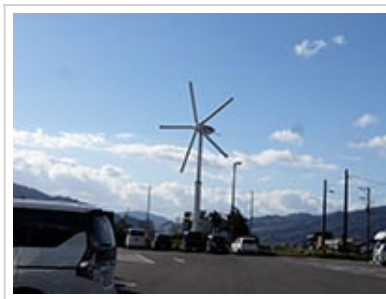
(3) 遠野ふるさと村 見学 (岩手県遠野市附馬牛町上附馬牛)