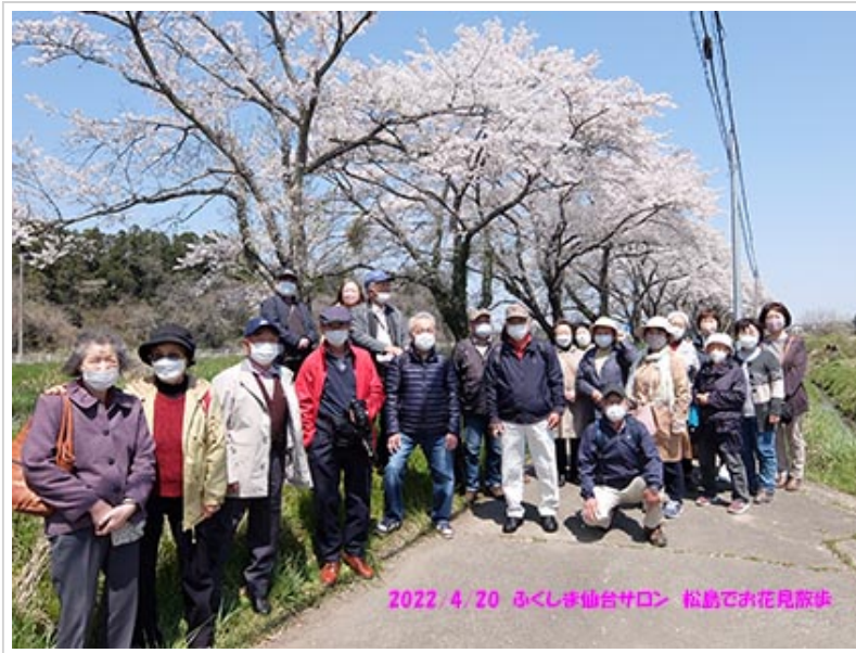
2022.4.20 ふくしま仙台サロン 松島でお花見散歩

午後は、松島から塩釜まで、丸文松島汽船(株)の遊覧船に乗り、松島観光を楽しみました。