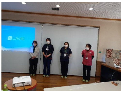
訪問看護の皆さん