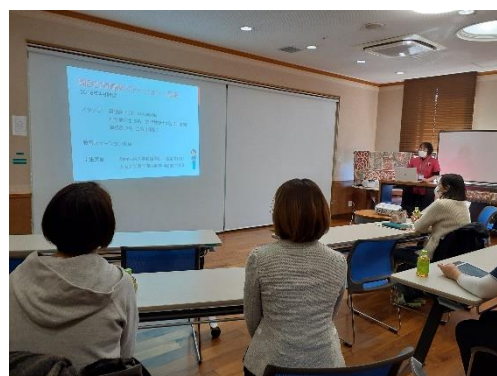
訪問看護の実際をレクチャー