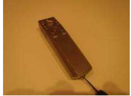
レーザーポインター