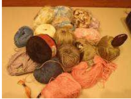
クレシェットレイ手芸糸