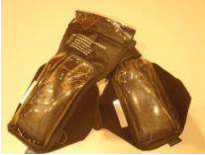
トランシーバー防水ケース