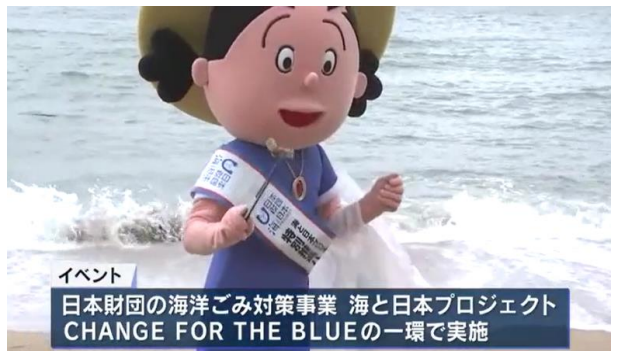
9月17日(土)21:24-21:27/サンテレビニュース