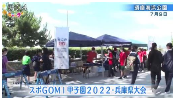
7月28日(木)17:00-17:55/NEWS×情報キャッチ+