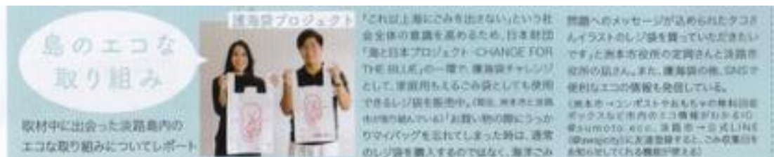
11月号／淡路島の地元情報誌ダン