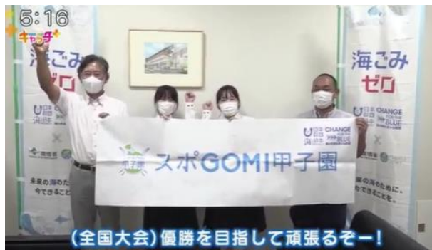
8月31日(水)17:00-17:55/NEWS×情報キャッチ+