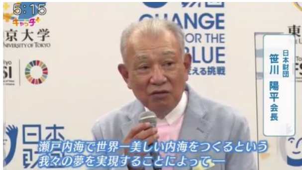
4月27日(水)17:00-17:55/NEWS×情報キャッチ+