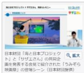
日本財団「海と日本プロジェクト」と「サザエさん」の共同企画を発表する会見で紹介された「うみぞら映画祭」の会場シーン

長寿アニメ「サザエさん」のオープニング映像に、兵庫県洲本市の名所・大浜海岸が登場した。気球に乗ったサザエさんが、波打ち際に巨大スクリーンをつるした「うみぞら映画祭」を眺める。約8秒間ながら、映画祭の関係者は「観光振興の弾みにしたい」と喜んでいる。（中村有沙）