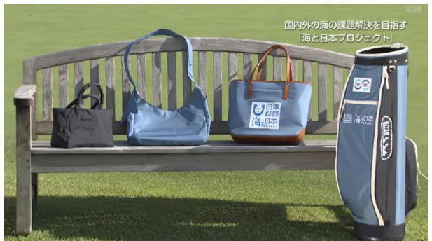
8月11日(木)23:00-23:30/真弓&勝成のExpertGOLF