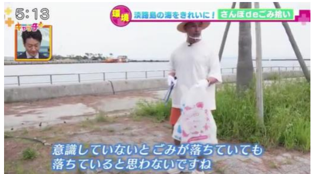
6月10日(金)17:00-17:55/NEWS×情報キャッチ+