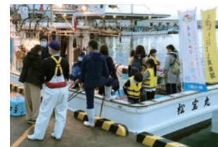
海の体験こども教室 シロエビ漁体験