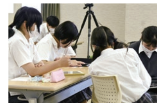
地域の高校生たちと プロモーション・メッセージを考える