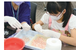
食の体験こども教室 シロエビ料理(殻むき・試食)を学ぶ