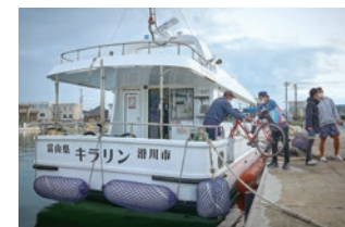
漁船タクシーで海から富山を体験する サイクリングツアー