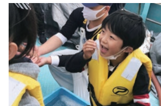
海の体験こども教室 シロエビ漁体験