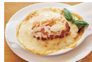
地域の飲食店・CAFEと連携した スペシャルメニューの食体験