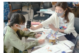
子どもたちが海を考えて情報発信 YouTuberになって発信!