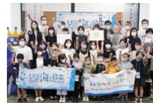
子どもたちと海を考える体験イベント