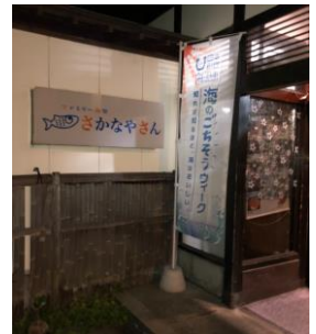
ファミリー食堂 さかなや