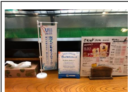
ファミリー食堂 さかなや