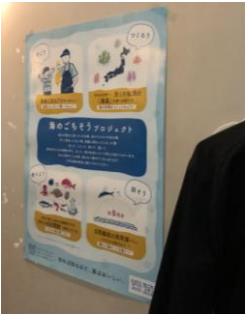
ファミリー食堂 さかなや