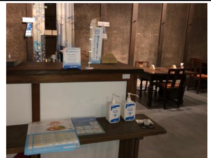
ユニコネルモンド