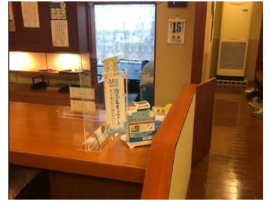
和風れすとらん二葉