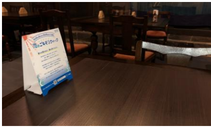
ユニコネルモンド