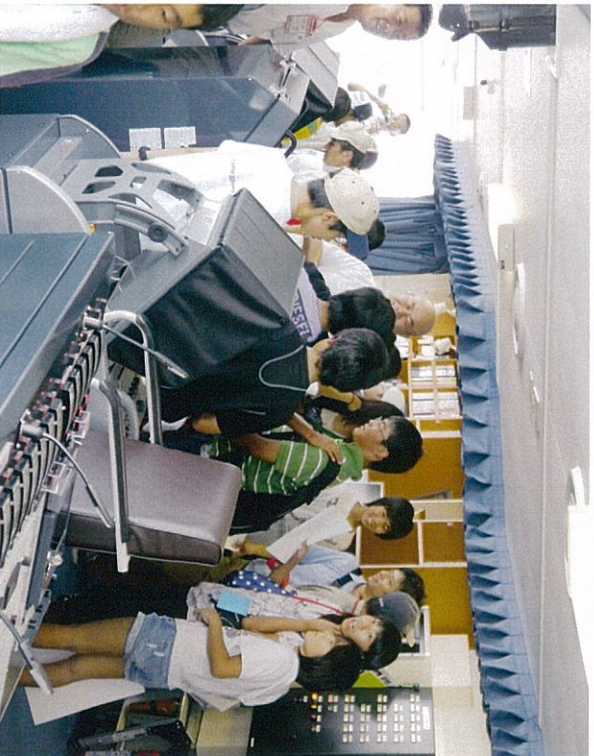
船橋（船を操船するところ）も見学