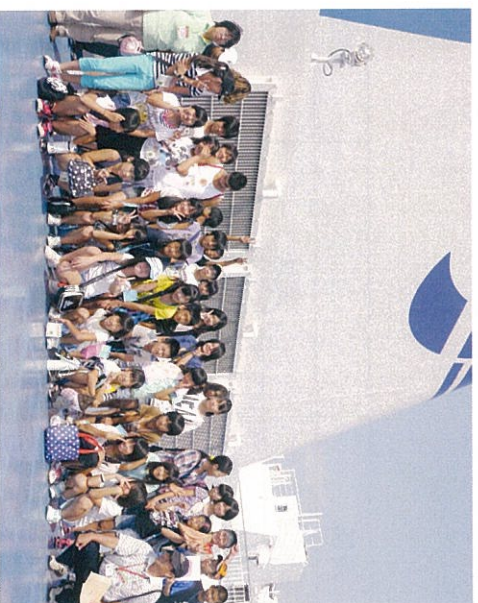
下の写真はバス二号車乗車組。