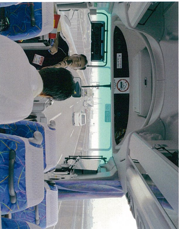
飛島コナチヤードが見えてきました。