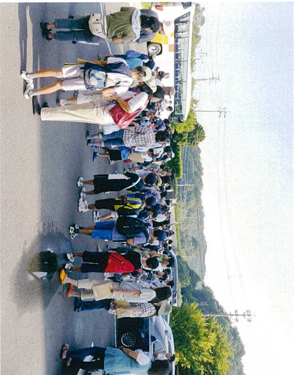
全員遅刻せず集合しました。