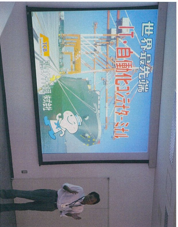
コンテナヤードの説明を受けました。