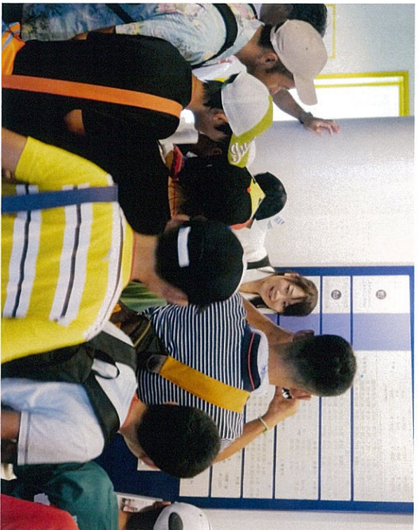
船内案内してもらいました。