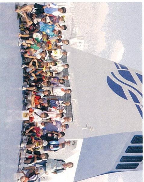
左は「いしかり」での集合写真です。バスー号車乗車組。