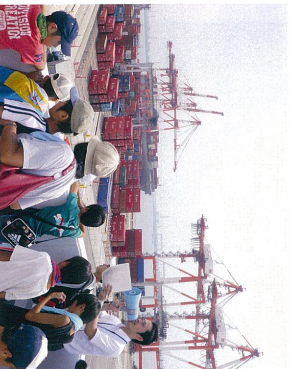
屋上からヤードの説明を受けました。