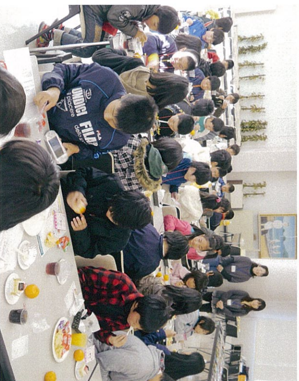
昼食後のピンコゲ ーム 良いクリスマスプ レゼントになった かな——