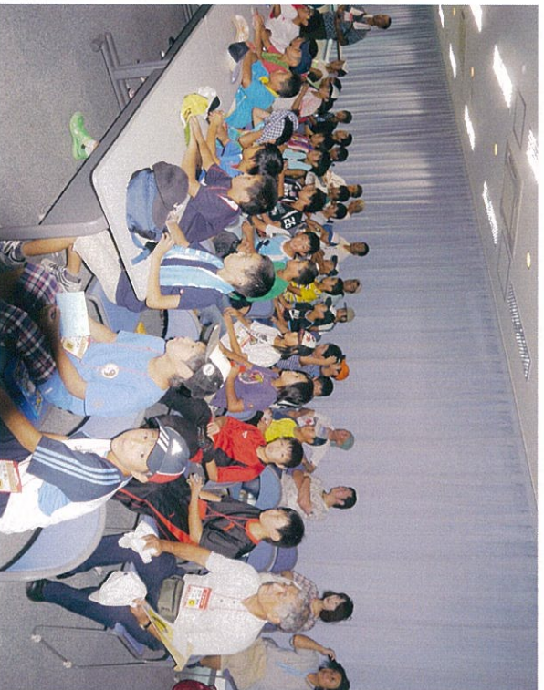
しっかり聞いています。