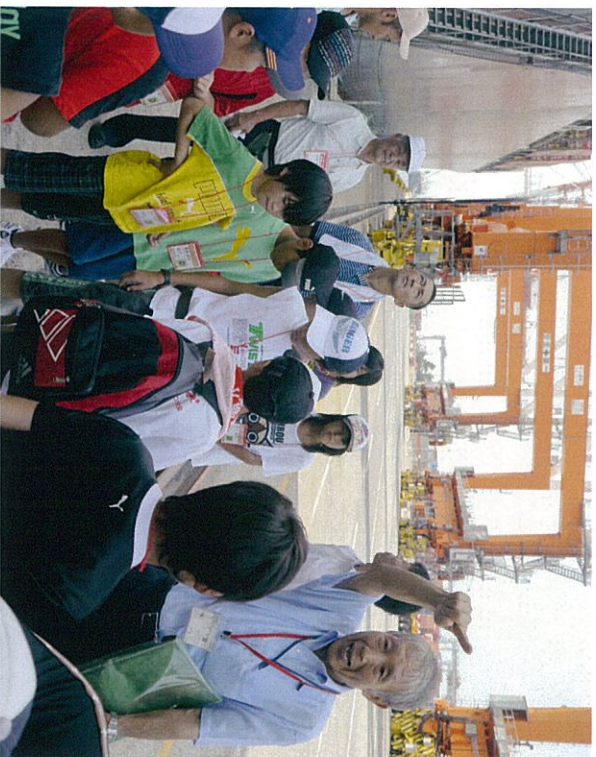
パイロットさんの説明を受けました。