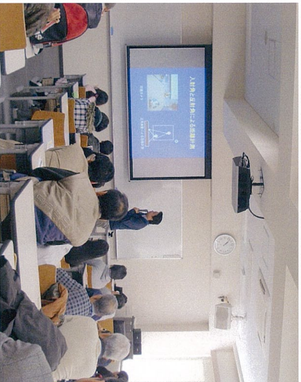
キネクトでスーパ ーサイヤ人になろ う 講師 江崎氏 入射角と反射角に よる距離計算 わかる？