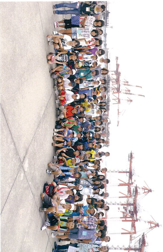
上はコンテナヤードでの集合写真。