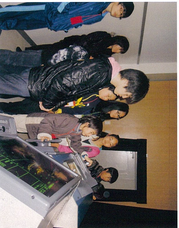
操船シミュレーター 一室 うまく操船出来た かな——