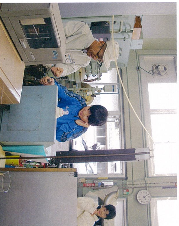
内燃機関室で エンジン起動！！