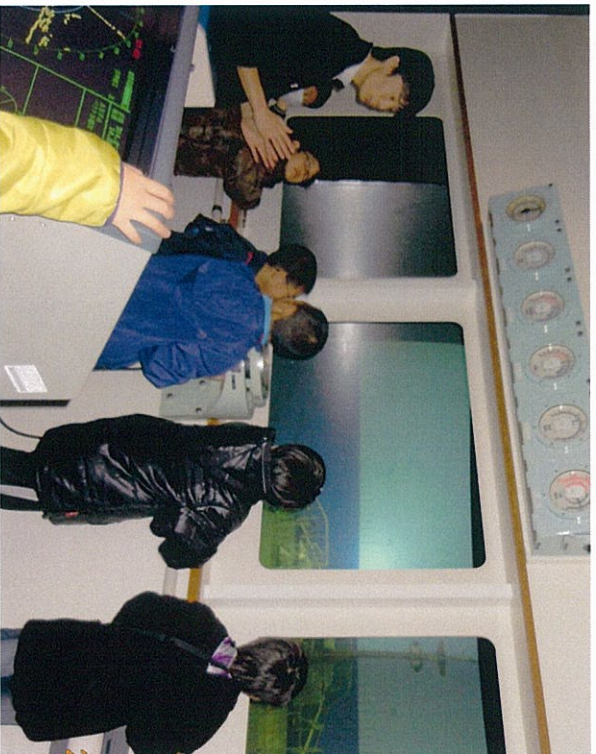
操船シミュレーター 一室で 大型船の操船体験