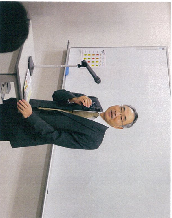
最後に 藤田鳥羽商船高等 専門学校校長の挨拶 でした。