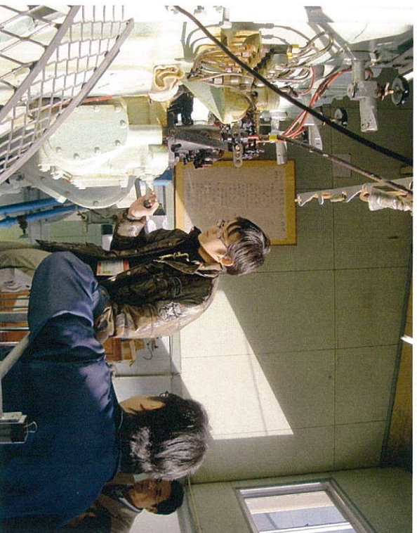
内燃機関室で 今度は エンジン停止!!