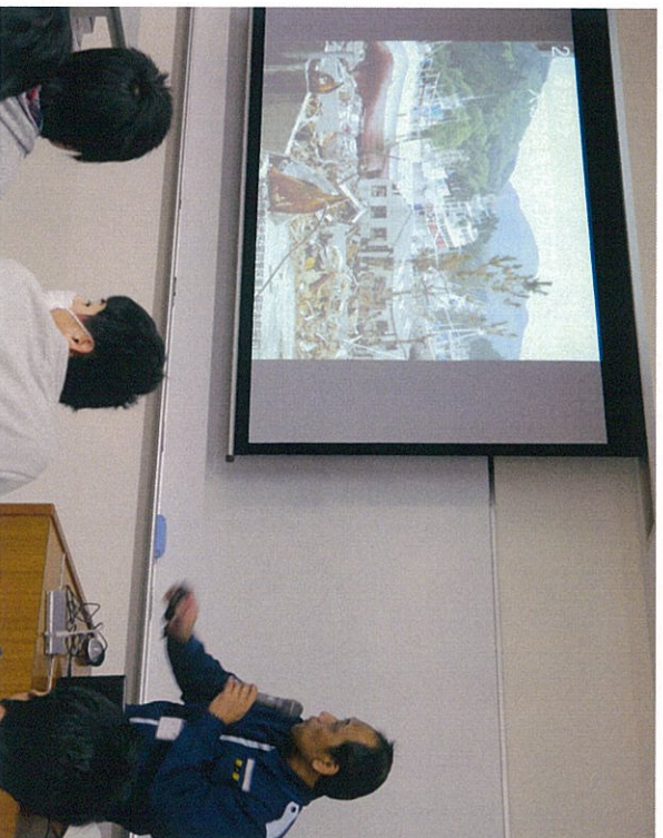
鳥羽海上保安部の 災害派遣体験談 惨状を振り返って