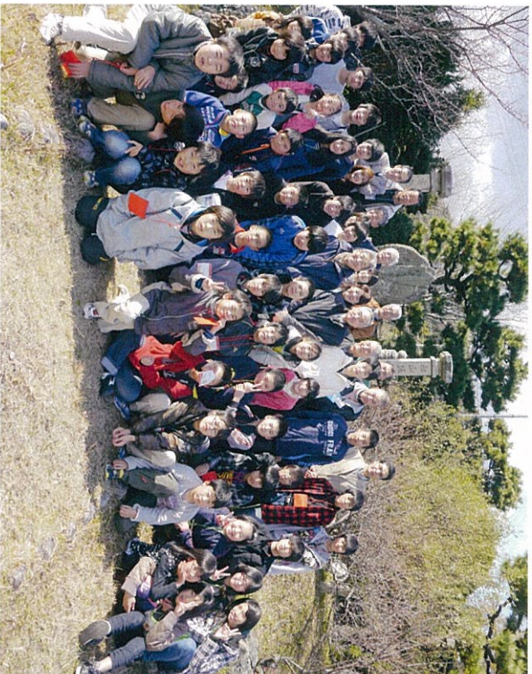
近藤真琴記念碑前で集合写真撮影 笑顔が良いですね