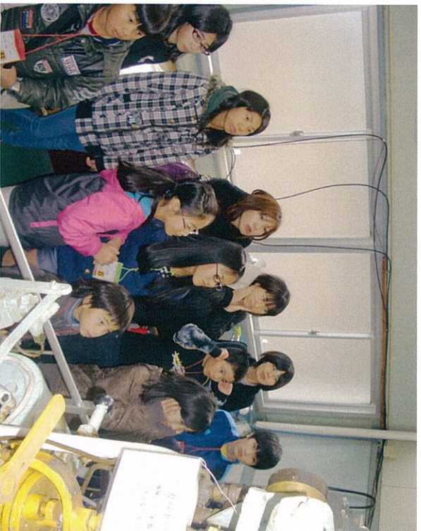
内燃機関室で 大きな音がするの で、耳をふさぎま しょう!!