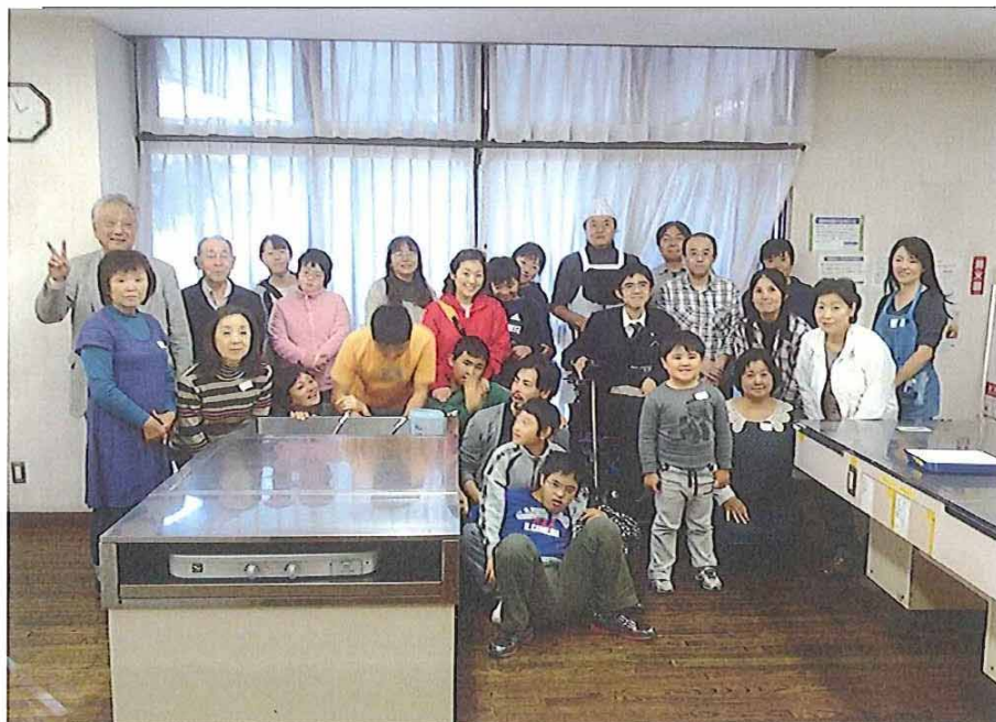
実施を終えて（感想等）