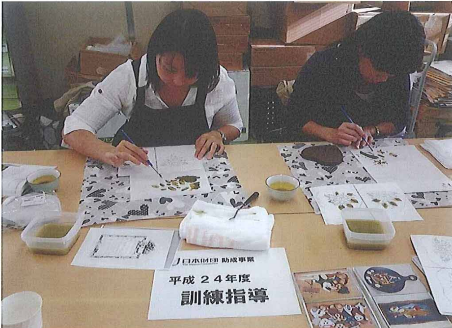
実施を終えて（感想等）

絵を描くのは得意ではないので不安でしたが、予め先生が解りやすい説明と共にお手本をして下さり、頭の中ではなんとか理解していざ練習の紙にペイントを始めるのですが、なかなか思うように筆が動かないもどかしさ、本番の木型に葉を1枚書くだけで大変な緊張でした。上手くやろうという気持ちは諦め筆を進めていくうちに、どんどんとそれらしい素敵な花の絵が出来上りました。筆使いによって色々な表現が出来るトールペイントに大変奥深いものを感じ、楽しい一時を体験できました。