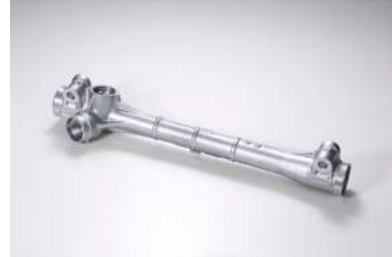
トランスミッションパーツ ステアリンクパーツ

アルミで鋳造したものを加工する工場、軽いので女性も多く働いている、メモを取ったり、質問したりと、関心がある方は積極的に見学されてました。