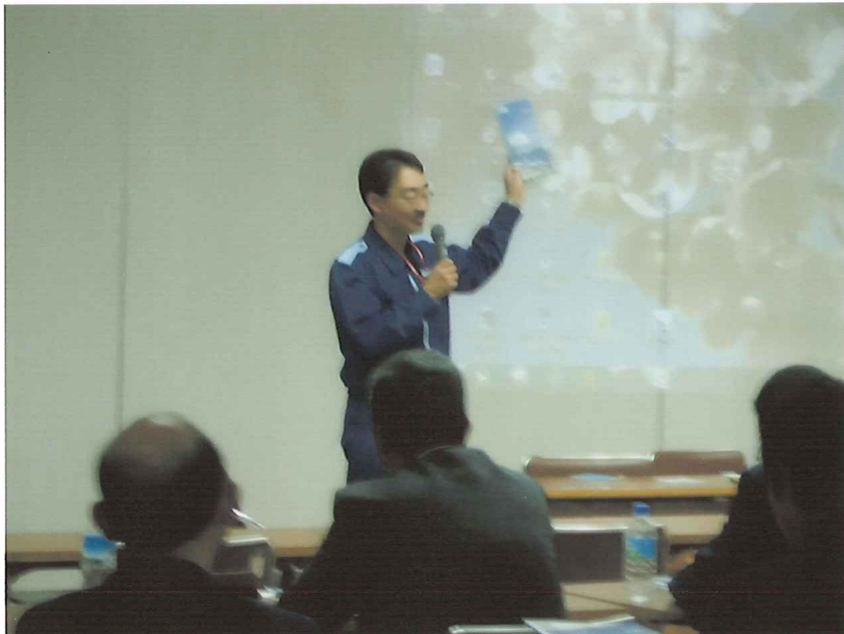
海上保安庁による東日本大災害の説明