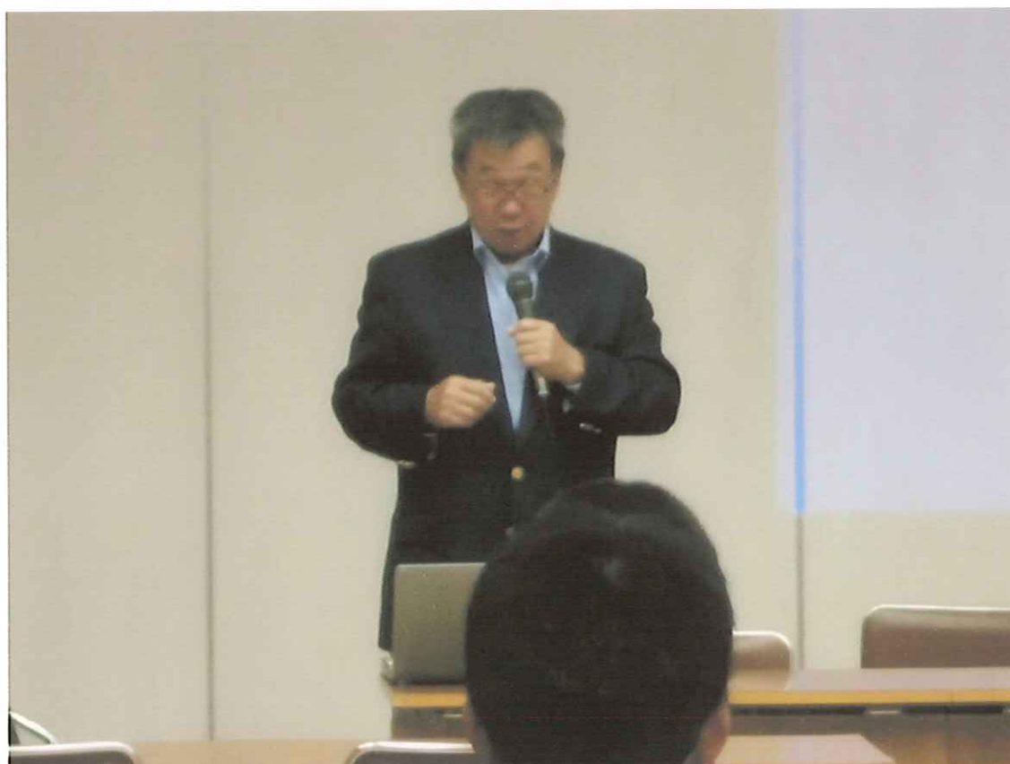
JSAF 西岡副会長のジュニア・ユースの育成についての講演