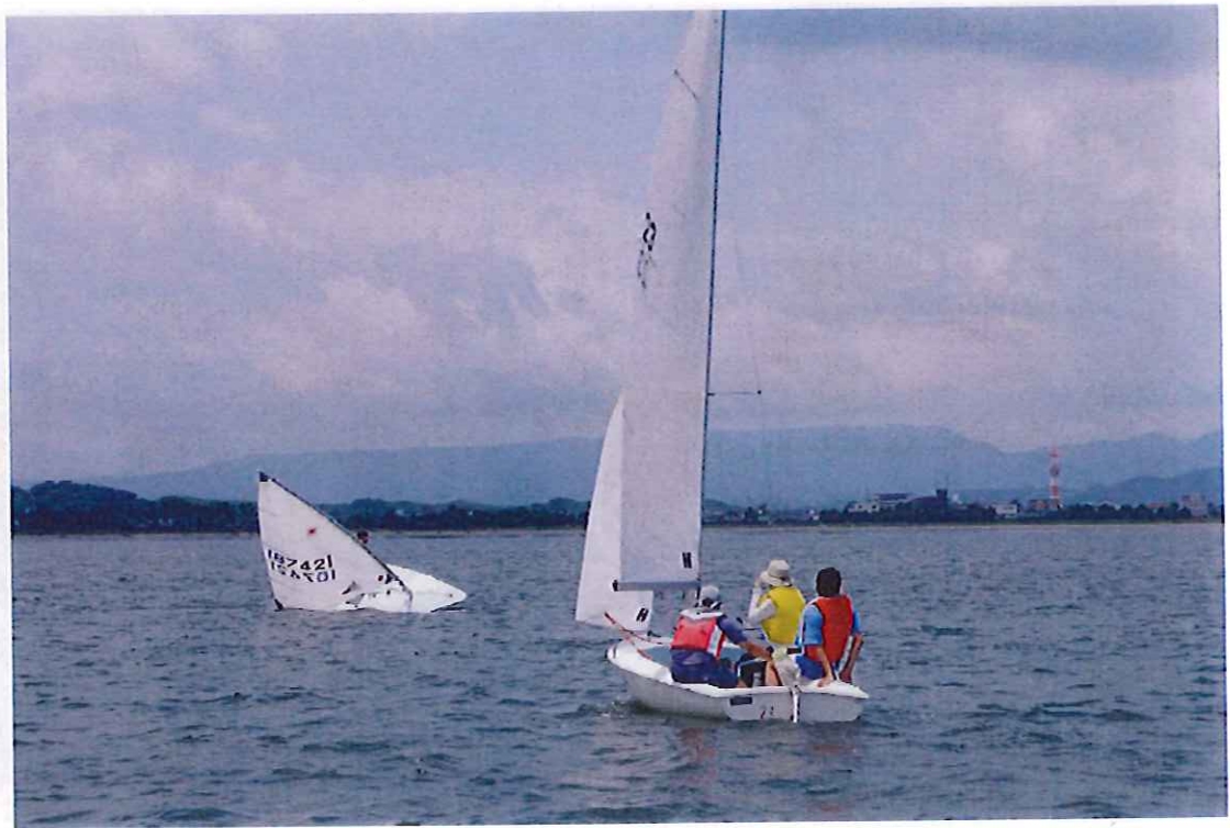
7月30日 海上にて 沈処理の実演