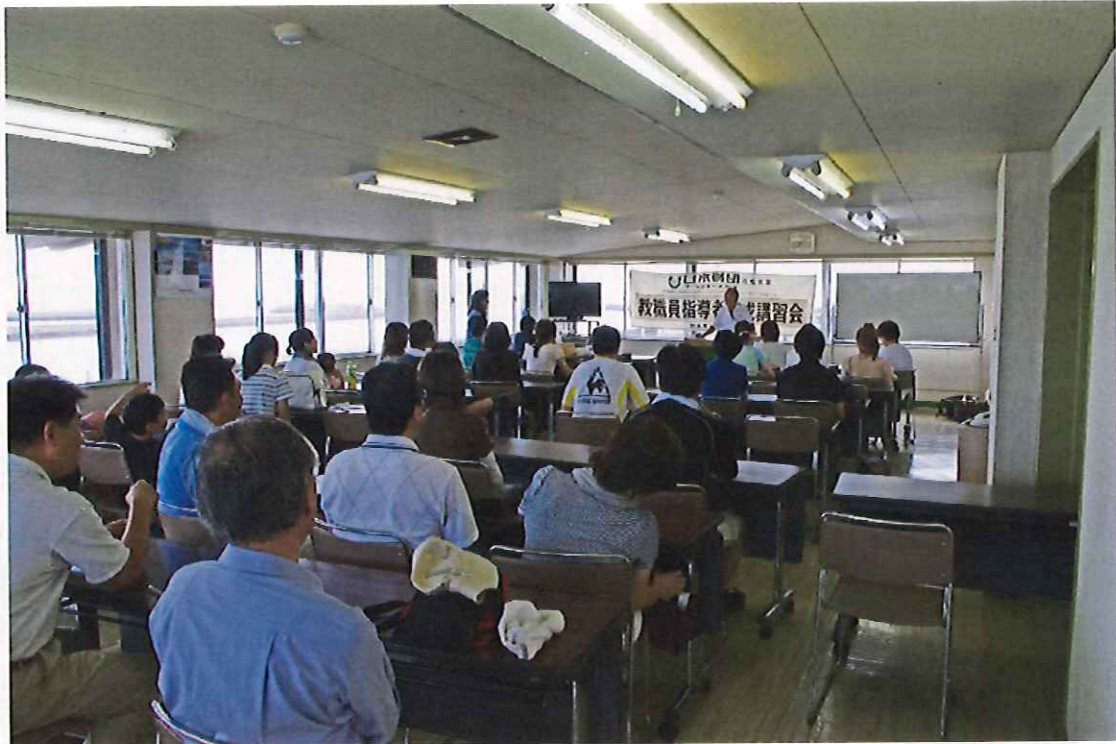
7月30日 開始時 会長挨拶