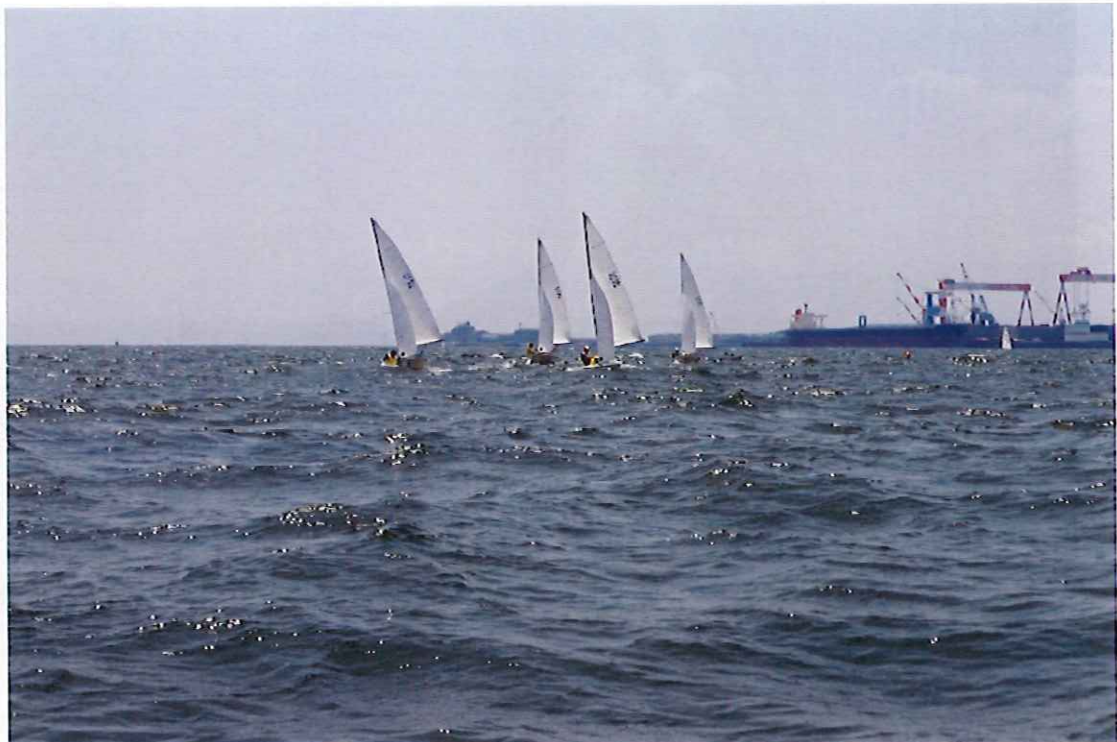
7月31日 海上にて 模擬レース体験