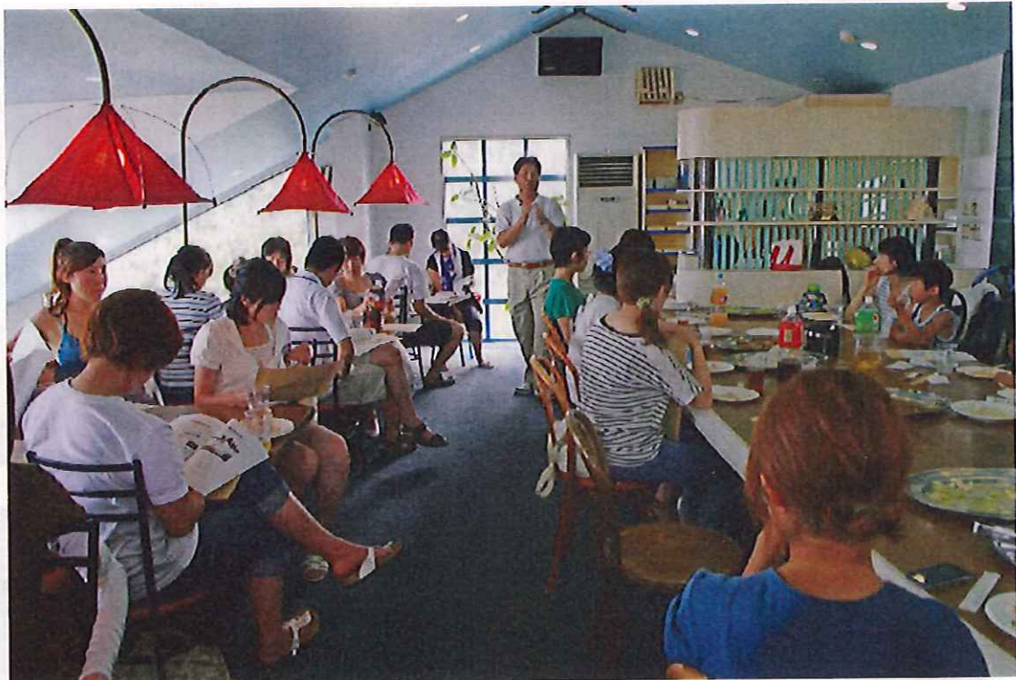
7月30日 午後 講演