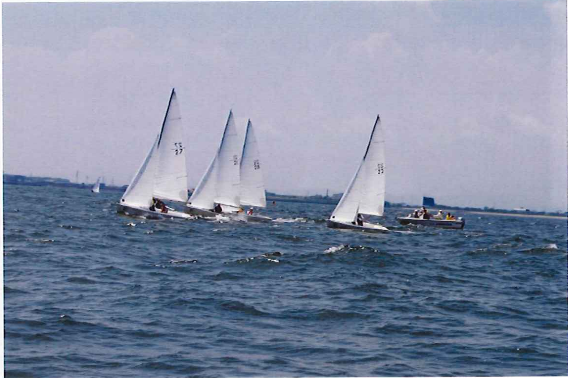
7月31日 海上にて 模擬レース体験