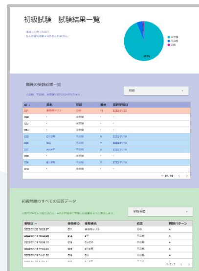
結果一覧の確認画面イメージ