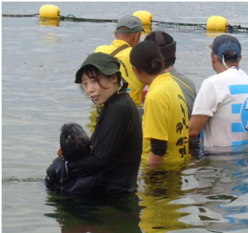
腰ぐらいの深さまで海に入り、イルカが来るのを待ちます。