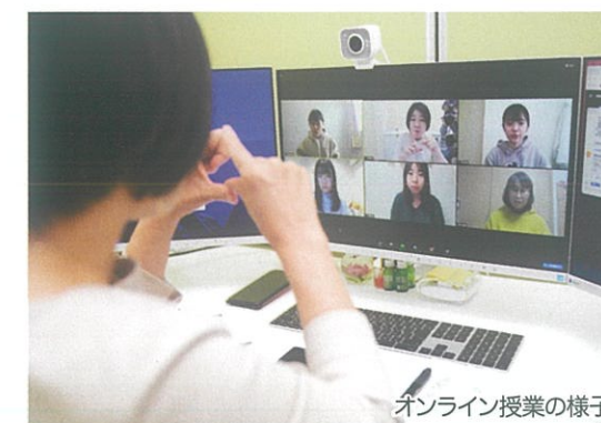
オンライン授業の様子