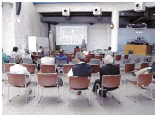
工学博士 赤嶺氏による講和