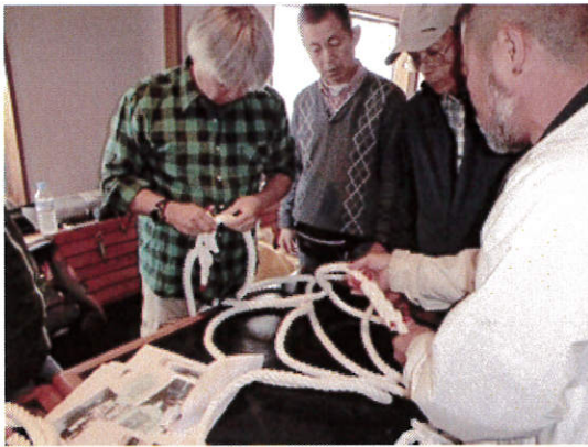
救命用品作成風景