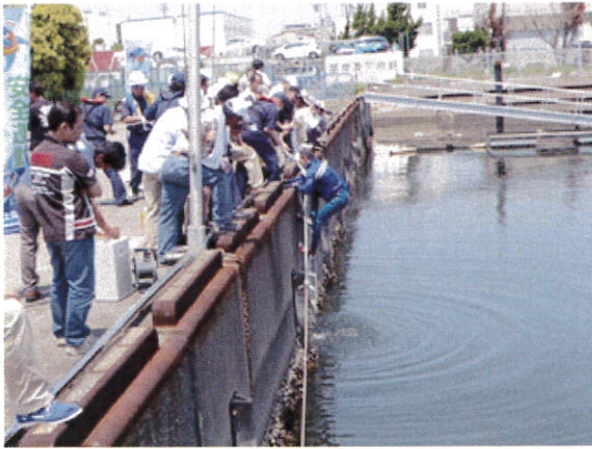
落水者救助実技指導