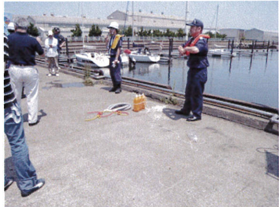
簡易救命具の説明