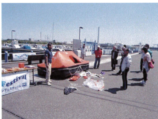
法定安全備品実演 1