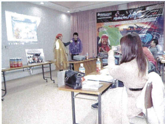
当協会講師講和の様子