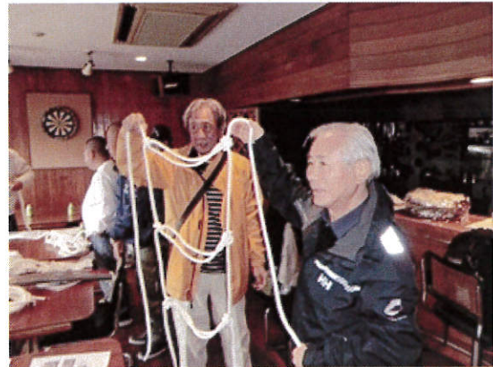
救命用品作成風景