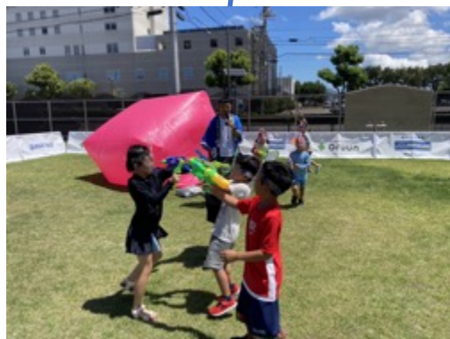
・ウォーターサバゲーエリア