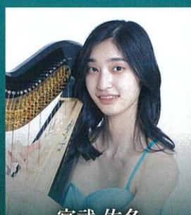
宮武 佑名 グリエール：ハーブ協奏曲 変ホ長調 op.74より第1楽章