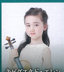
キビグスタド・エレン モーツァルト：ヴァイオリン協奏曲 第3番 ト長調 K.216より第1楽章