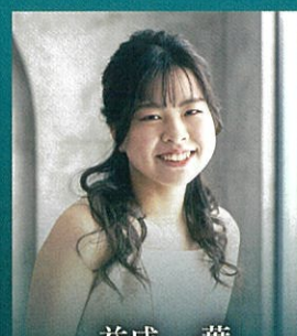
益成 一葉 ショパン：ピアノ協奏曲第2番 へ短調 op.21より第1楽章