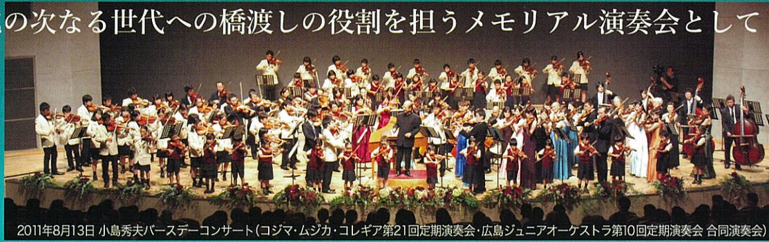
2011年8月13日 小島秀夫バースデーコンサート(コジマ・ムジカ・コレギア第21回定期演奏会・広島ジュニアオーケストラ第10回定期演奏会 合同演奏会)

広島交響楽団首席コンサートマスターを長年務めた故・小島秀夫が、次世代の演奏家の育成と子どもたちの夢を育む活動をめざして発足した「コジマ・ムジカ・コレギア」と「広島ジュニアオーケストラ」。2つの活動の節目となる定期演奏会を記念するとともに、2022年5月に他界した小島秀夫の偉業を称え、両活動のOB・OGや小島秀夫の門下生たちが一同に会し、音楽文化の次なる世代への橋渡しの役割を担うメモリアル演奏会として本公演を開催します。