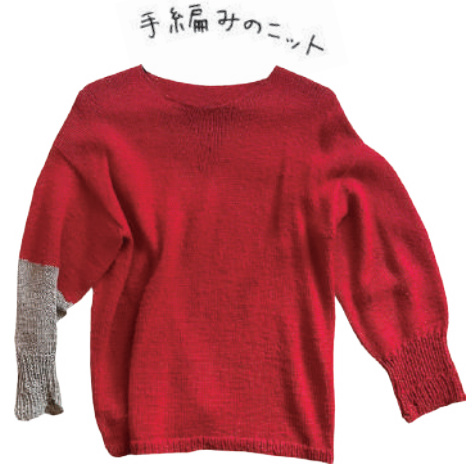
手糸編みのニット