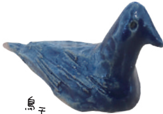
鳥モチーフのオブジェ