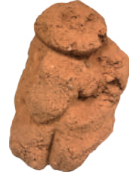
火田の 神楽 木楽