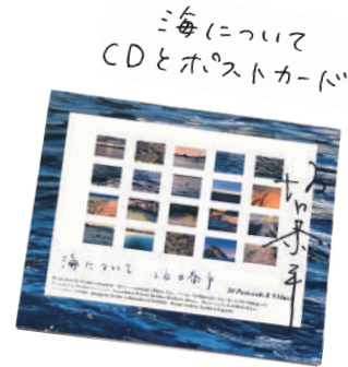
海について CDとポストカード