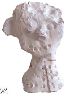
手びねりの立体物