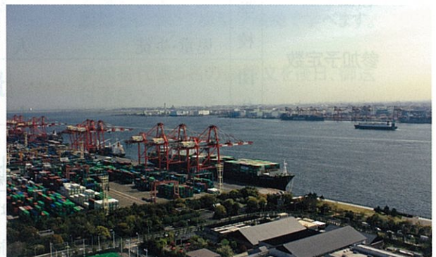
▲東京みなと館からの景色