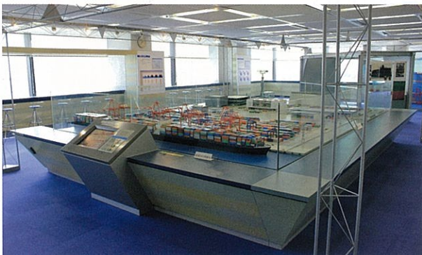
▲東京みなと館の館内