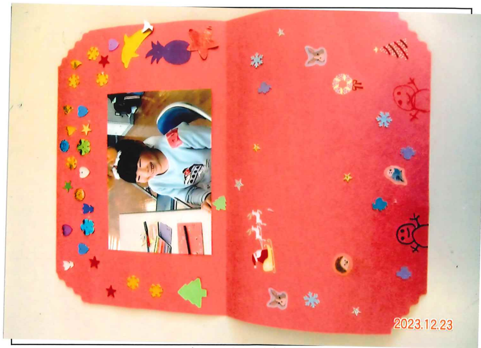
(2023'12月23日 フォトフレーム)