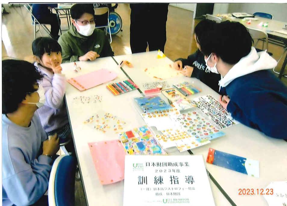
(2023'12月23日フォトフレーム)