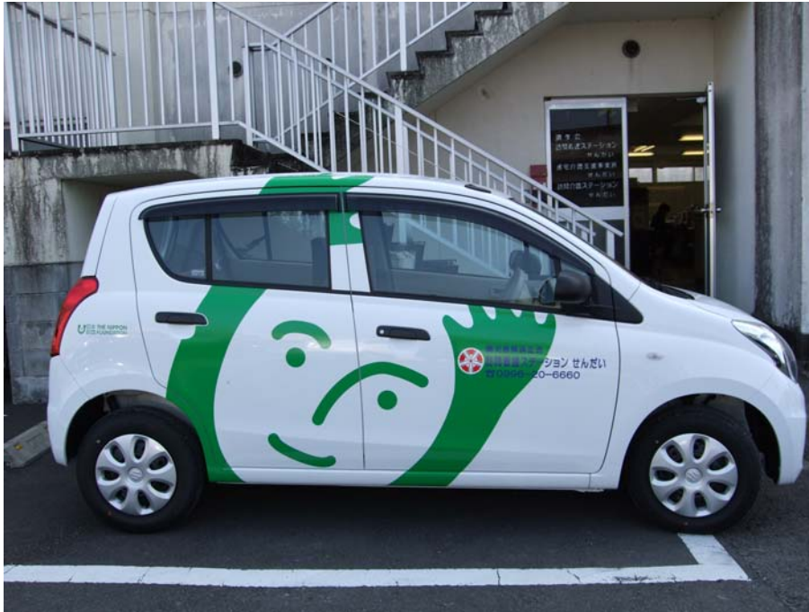
○車いす対応車（軽自動車）：特別養護老人ホーム聖和園（福井県）