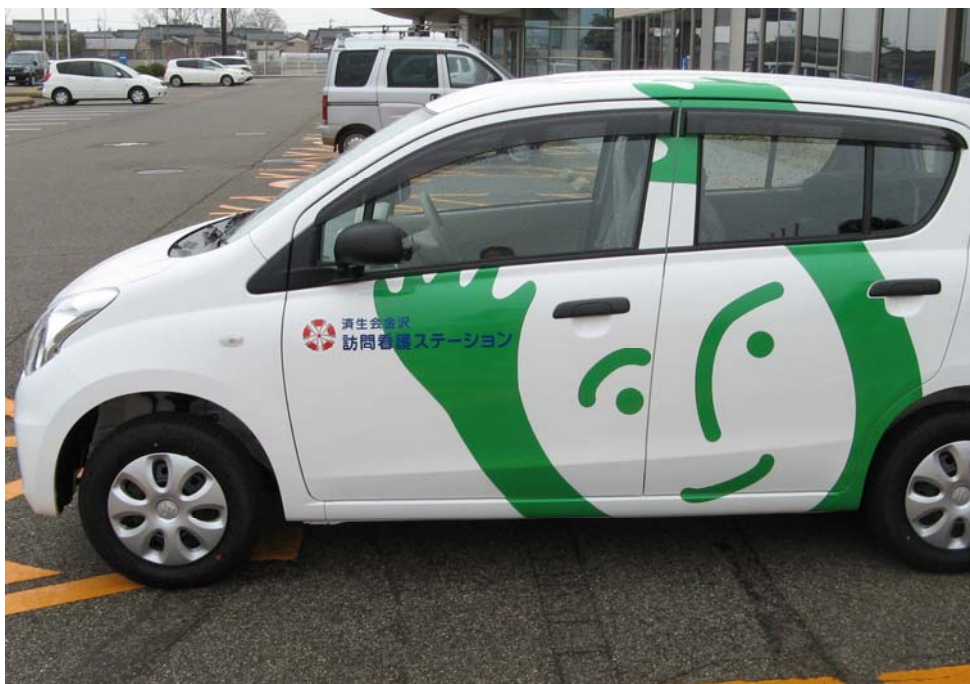
○ ヘルパー車：福井県済生会訪問看護ステーション（福井県）