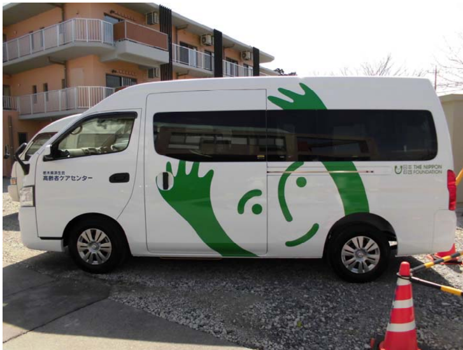
○送迎車（普通車）：済生会ワークステーションみのり（埼玉県）