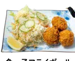
魚っ子フライボール