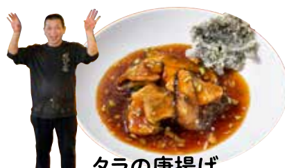
タラの唐揚げ きのこあんかけ