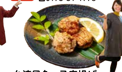
台湾風魚っ子唐揚げ