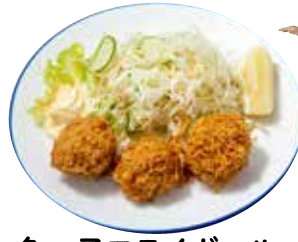
魚っ子フライボール