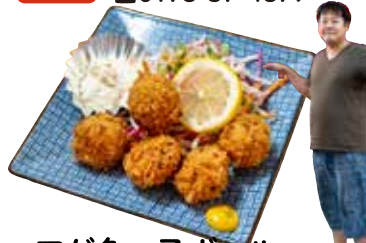
アゲ魚っ子ボール