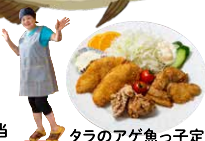
タラのアゲ魚っ子定食