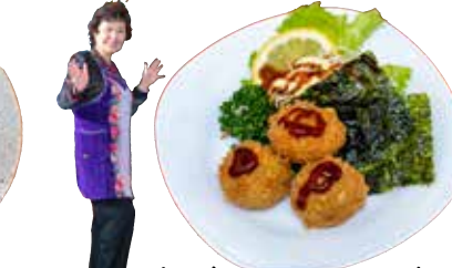
魚ぎよつとフライボール