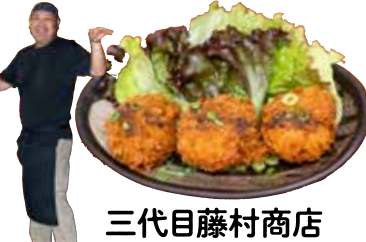
三代目藤村商店 特製塩だれアゲ魚っ子