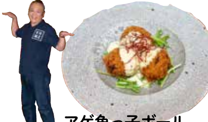
アゲ魚っ子ボール わいほのタレマヨネーズソース