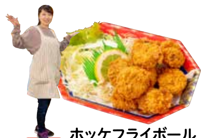
ホッケフライボール