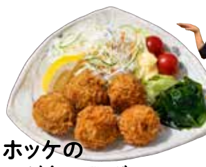
ホッケの アゲ魚っ子ボール