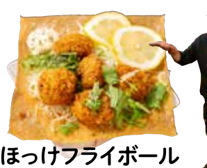
ほっけフライボール タルタルソースを添えて