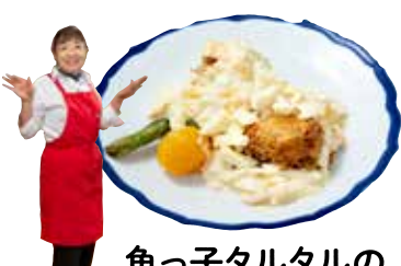
魚っ子タルタルの 野菜添え