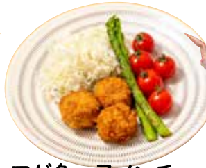
アゲ魚っ子メンチ