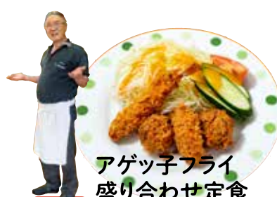
アゲっ子フライ 盛り合わせ定食