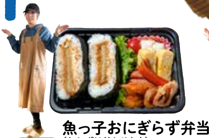
魚っ子おにぎらず弁当