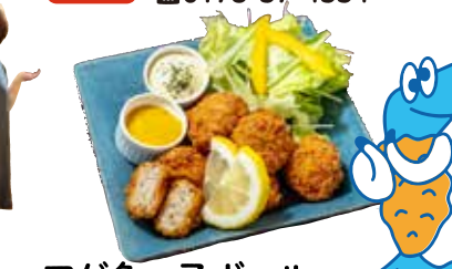
アゲ魚っ子ボール