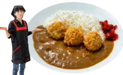
アゲ魚っ子カレー