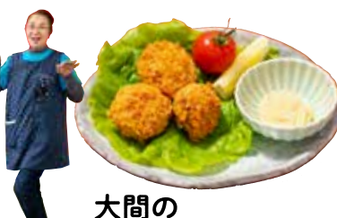
大間の アゲ魚っ子フライ