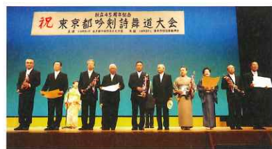
一番右が優勝の渋谷区連、以下2位～5位で中野、南多摩一、足立、杉並各区連(各2人)