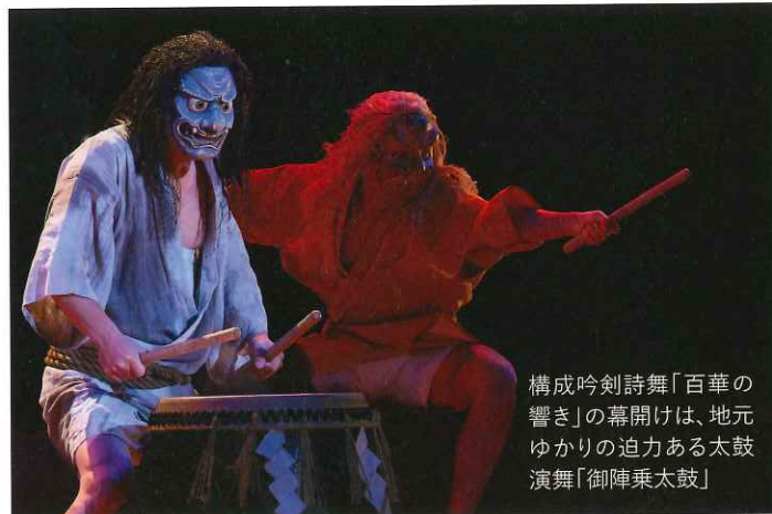
構成吟剣詩舞「百華の響き」の幕開けは、地元ゆかりの迫力ある太鼓演舞「御陣乗太鼓」

石川県で国民文化祭が開催されるのは平成4年(1992年)の第7回大会以来、31年ぶり2回目の開催となりました。加賀百万石が育んだ伝統芸能や伝統工芸、祭りや食、そしてクラシック音楽や現代アートなどの催しが10月14日から11月26日まで、県内各所で繰り広げられました。キャッチフレーズは「文化絢爛」。10月15日の開会式には天皇皇后両陛下が出席。金沢の街全体が文化イベントで賑わう中、吟剣詩舞の祭典は10月22日に開催されました。