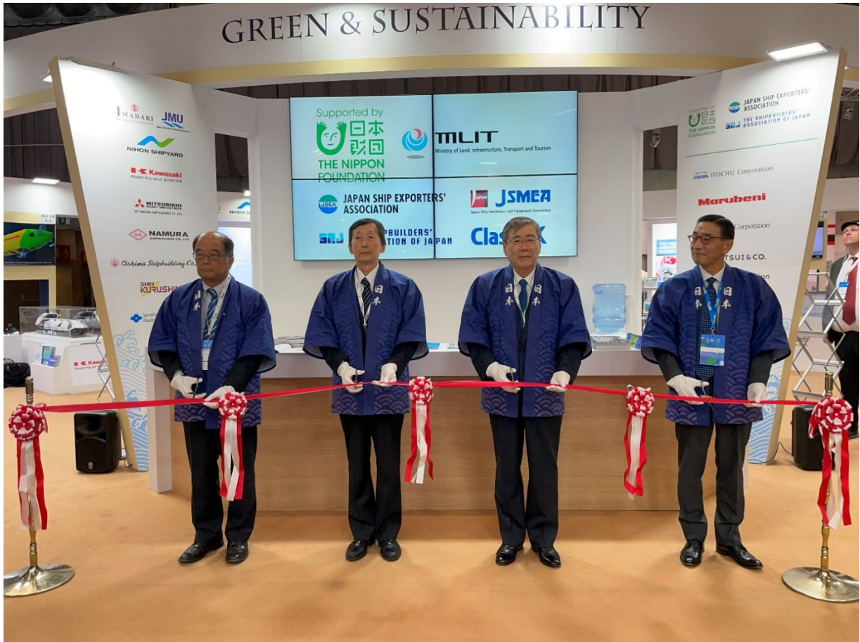
日本スタンド開場式 左より木下船用工業会会長、川村日本大使、宮永日本船舶輸出組合理事長、坂下日本海事協会会長