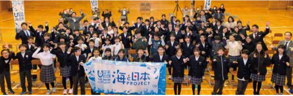
東通村・東通小学校、東通中学校 2023/11/15・12/8