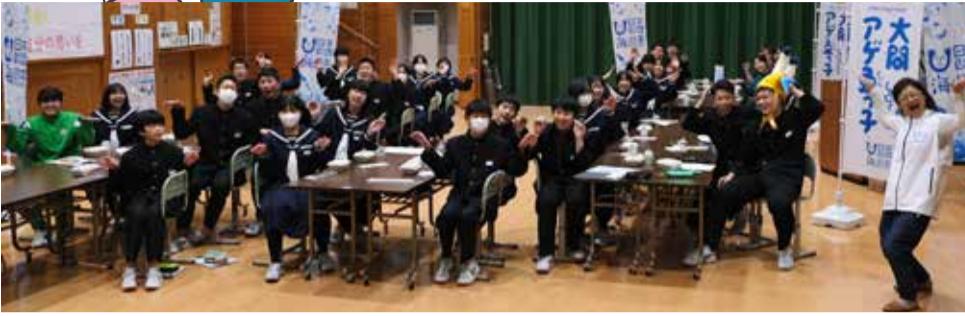
佐井村・佐井中学校 2023/11/13