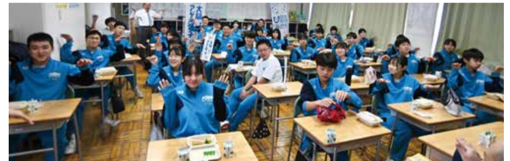
大間町・大間中学校 2024/2/2