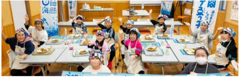
大間町・奥戸小学校 2023/11/13