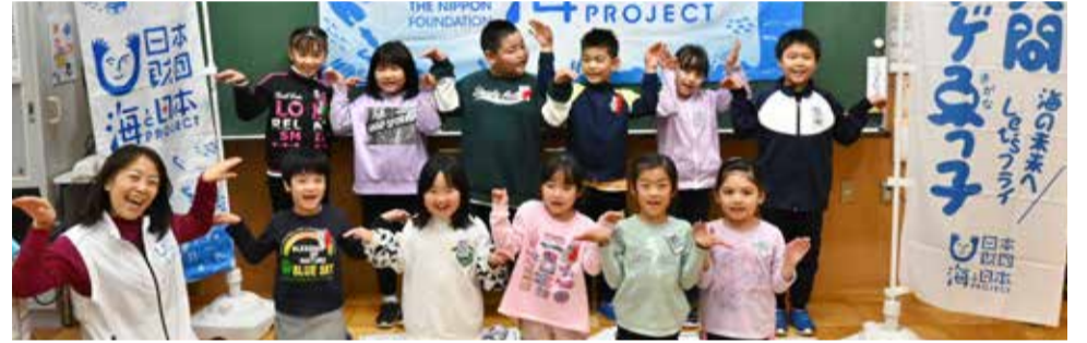
むつ市・川内小学校、川内中学校 2023/11/17