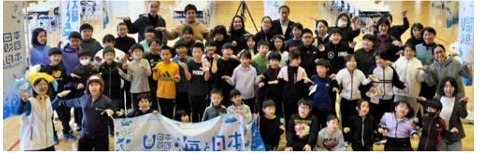
風間浦村・風間浦小学校 2023/11/16