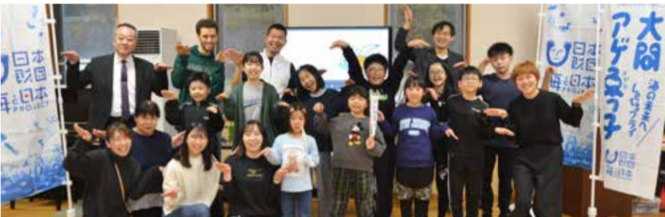
むつ市・脇野沢小学校、脇野沢中学校 2023/11/17