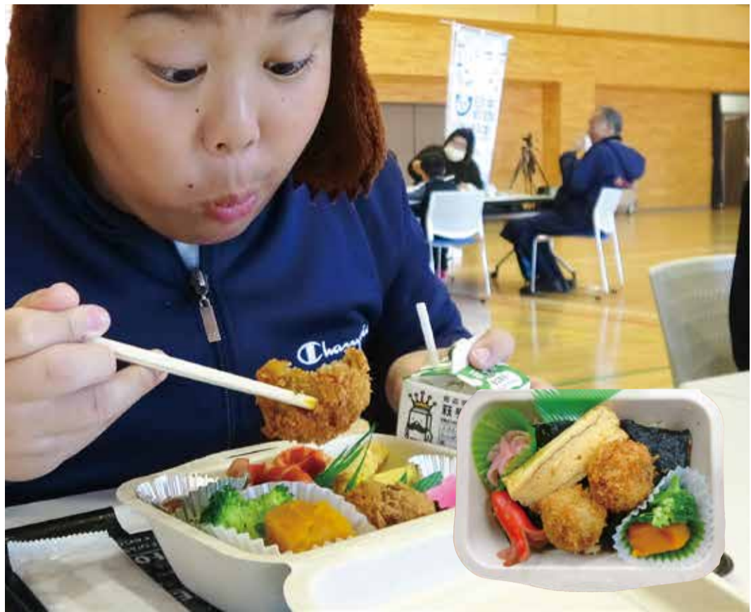
海苔の下にはヒジキの混ぜごはん、アゲ魚っ子ボール入りの「海のアゲ弁」が大好評！

食を通じて子どもたちの海への興味関心を喚起し、「豊かな海を守る」とする心を育む「海の食育」活動。2021年度に大間町からスタートし、3年目となった2023年度は下北半島全5市町村の11小中学校へと広がりを見せました。昨年の11月13日～17日の1週間を「下北半島海の食育ウィーク」に設定し、「食べて知ろう！学ぼう！わいだちの海」をテーマに、約1150食分のアゲ魚っ子ボールを無償提供して海の学びの出前授業を開催。さらに、大間、奥戸、風間浦の3つの小学校では独自の体験授業を実施し、海の問題への学びをさらに深めました。