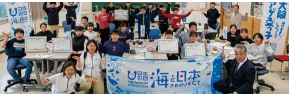
大間町・大間小学校 2023/11/17