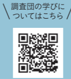
調査団の学びについてはこちら

広島県内20名の小学生が『瀬戸内子ども調査団in宮島』に参加し、一見異なる、名産の牡蠣と幻のミヤジマトンボを通して、広島の特徴や抱える課題を調査し学びました。今回、彼らが学んだ宮島の海に生きるいきものをイメージして描いたイラストをお饅頭に刻印しました。