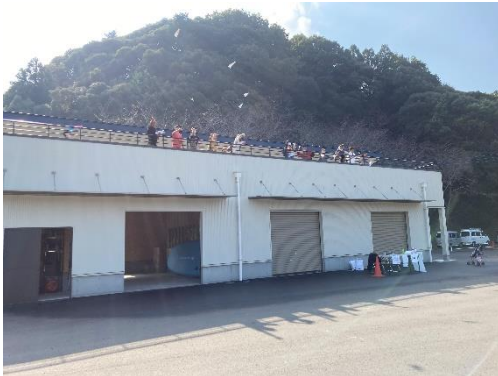
折り紙ヒコーキを艇庫 2 階から飛ばす