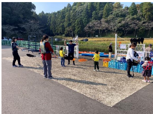
漕ぎ方を習う参加者