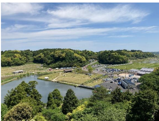
橘ふれあい公園 全景