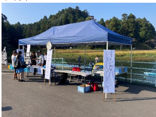
カヌー・足漕ぎボート受付