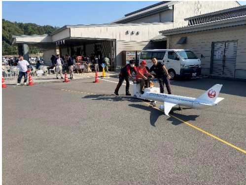
ミニプッシュバック体験