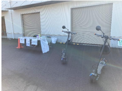
電動キックボード試乗体験