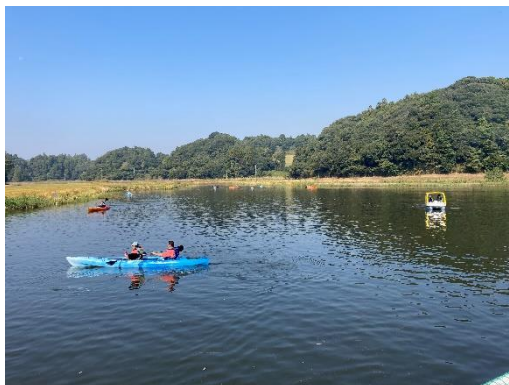
カヌー・足漕ぎボート体験の様子