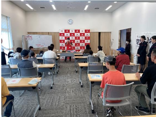
JALによる折り紙ヒコーキ教室の様子