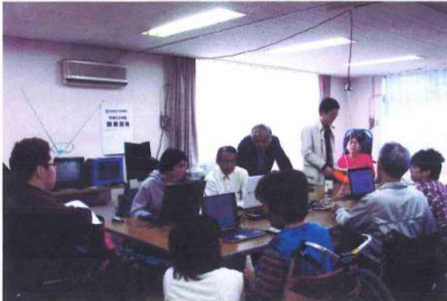
事業の実施状況写真