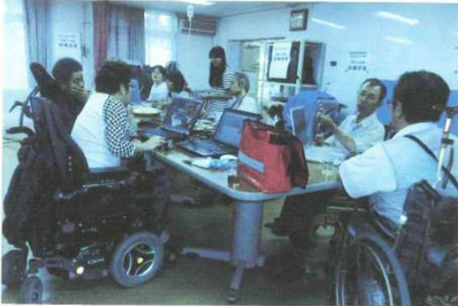
事業の実施状況写真