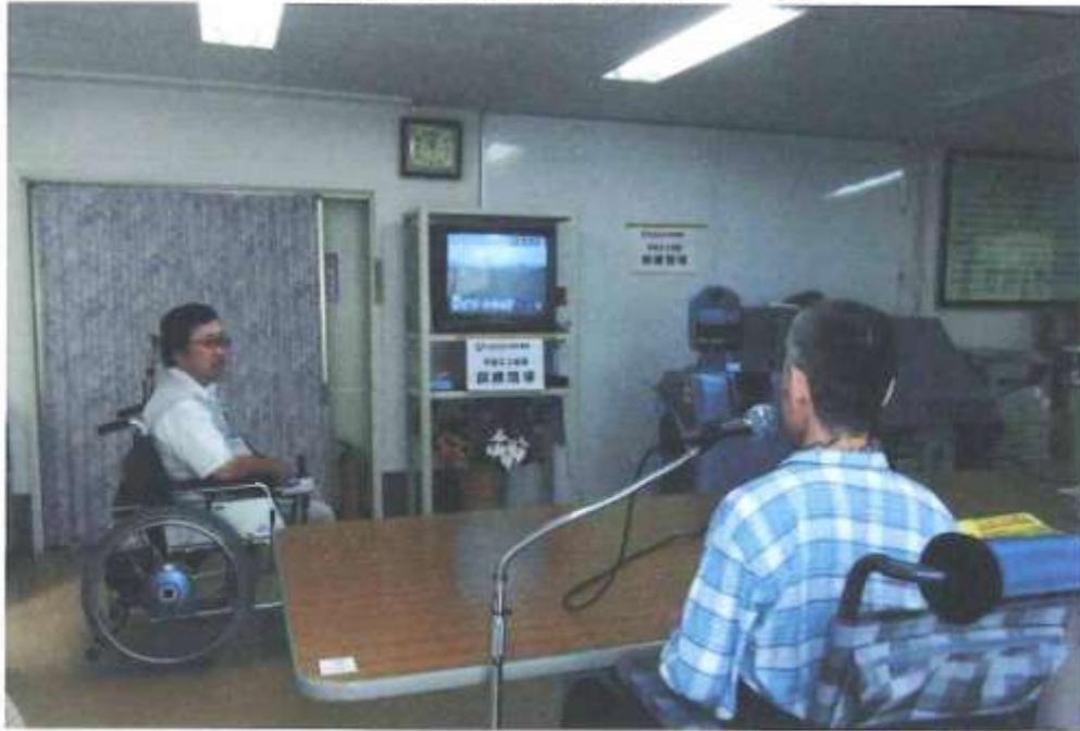
事業の実施状況写真