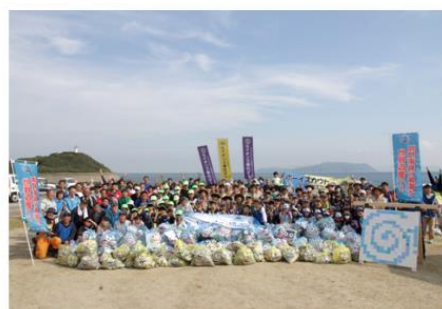
紀淡海峡 洲本市由良町 生石海岸

目的：世界でも稀有な自然美であり、世界最大級である“鳴門の渦潮”を世界遺産に登録することを私たちは目指しています。渦潮の発生に重要な役割をもつ3つの海峡（鳴門海峡・紀淡海峡・明石海峡）の環境を守ろうと、市民を中心に海岸清掃を実施しました。