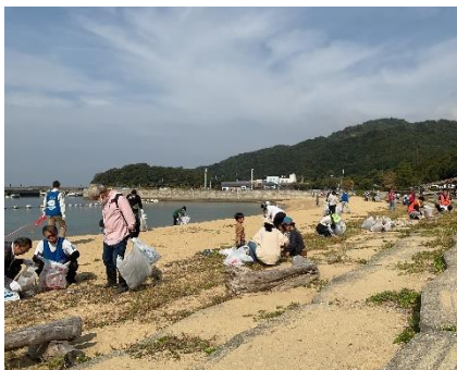
淡路島・鳴門海峡 伊毘