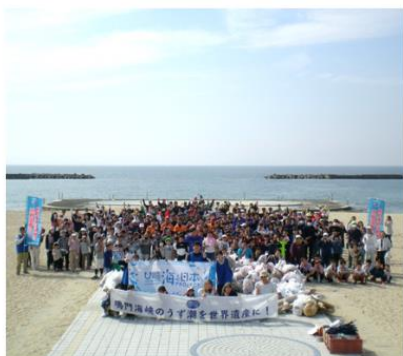
鳴門海峡 南あわじ市阿万西町 阿万海岸