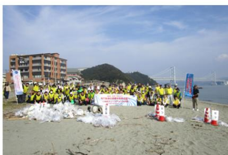
鳴門海峡 鳴門市鳴門町 千鳥ヶ浜海岸