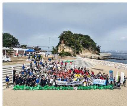
明石海峡 淡路市岩屋 田ノ代海岸