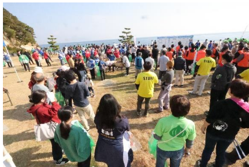
左 淡路島・鳴門海峡 阿万：淡路三原高校ボランティア同好会による司会進行