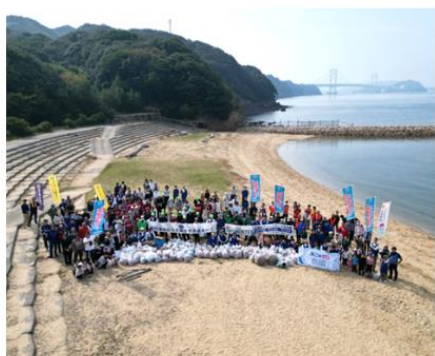
鳴門海峡 南あわじ市阿那賀 伊弉海岸