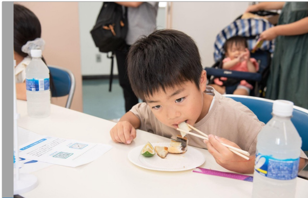
子ども海洋体験イベントでは、 自分ゴトとしてアイゴを食べたという経験を獲得