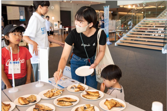
初年度のキックオフイベントから 対象魚アイゴの試食を実現