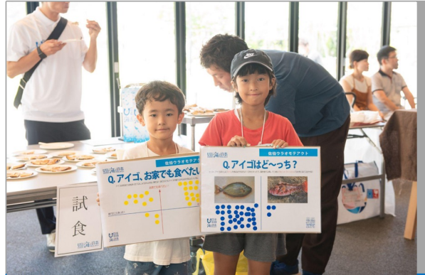
幼稚園生、小学生の参加による多世代での 海の学びを提供