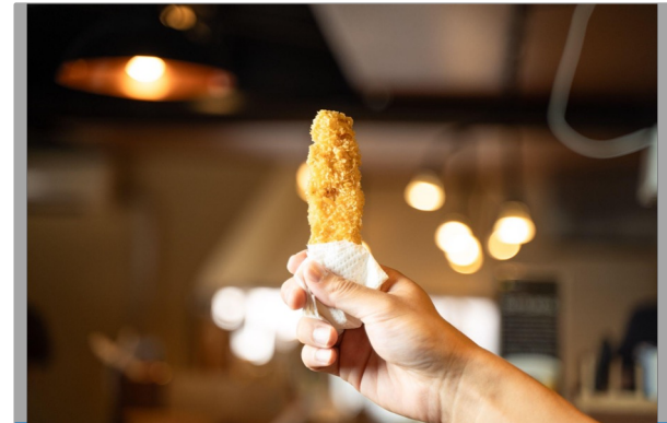
アイゴのフライ【アイボー】