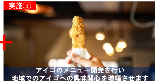
アイゴのメニュー開発を行い地域でのアイゴへの興味関心を増幅させます