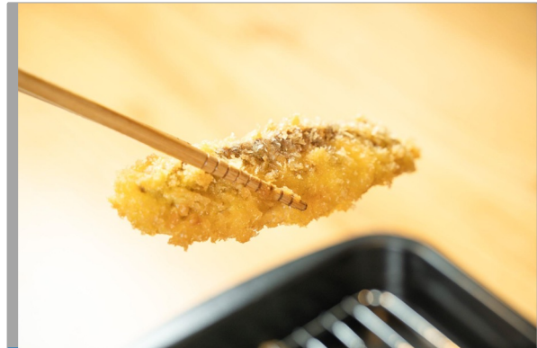
初年度からアイゴを活用したメニュー開発が実現 教育委員会、栄養教諭の方たちの意見も反映