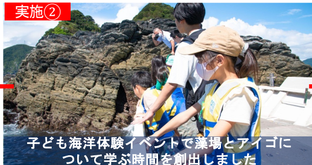
子ども海洋体験イベントで藻場とアイゴについて学ぶ時間を創出しました