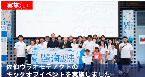
佐伯ウラオモテアクトのキックオフイベントを実施しました