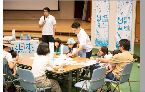
藻場、磯焼けという説明の難しいワードだが、 子どもたちから磯焼けの説明ができるまでに成長