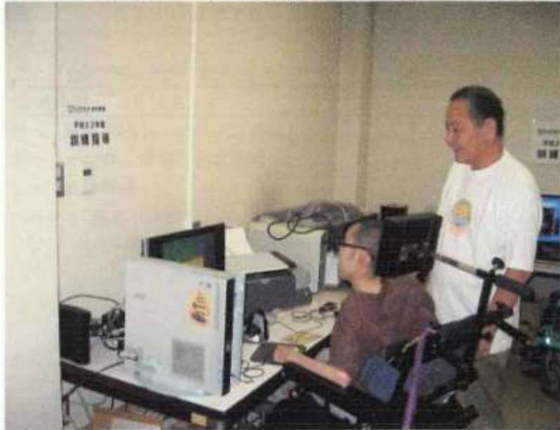
事業の実施状況写真