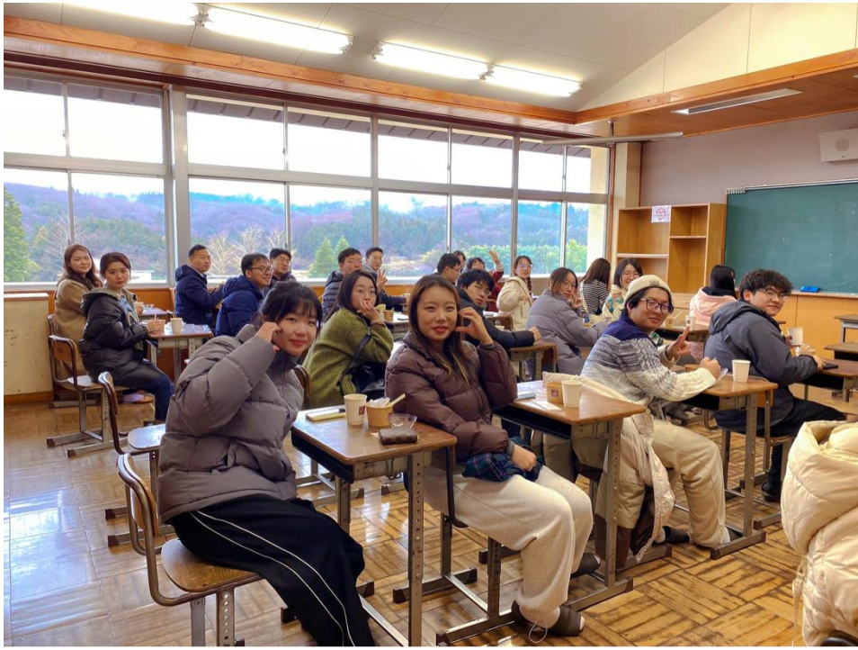
モンブランを味わう体験