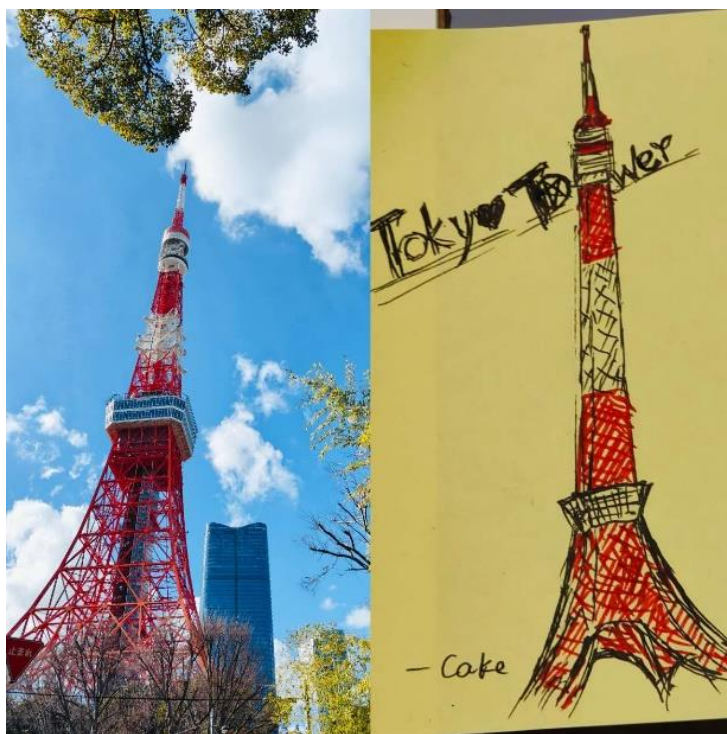
青空の下の東京タワー

道中では赤白に配色された東京タワーが見え、東京の晴れ渡った青空と非常に美しい都市の景観を構成していました。観光客がたくさんいる浅草寺、増上寺、稲荷神社といった宗教施設の見学では、都市生活と高度にからみ合った宗教文化を感じました。日本の仲間の案内で新宿御苑に行くと、心をこめて剪定された花と木の下には遊覧客で「埋め尽くされた」黄色い芝生があり、そこに加わって、そよ風の中で中国語と日本語をまぜこぜにして談笑しました。河口湖のほとりから遠くの富士山を眺めると、富士山の気質は静謐にして清浄で、日光を反射してできた無形のハロは人の心のすべての隅を照らしているかのようでした。若山農場の竹林では、しとしとと小雨が降っており、その中をそぞろ歩きしてお茶を味わうと、お茶請けの栗菓子がとても甘く、そうしたどれもが特別な思い出です。その過程で、同行した中日両国の友人といっしょに美しい景色を楽しみ、美食を味わい、経験を分かち合い、未来を語り合いました。