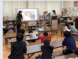
クイズや工場の動画を 交えて毛織物の魅力を伝える社員先生