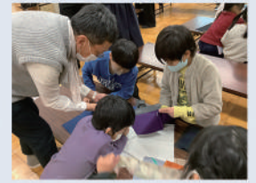
企業の資材を活かしたワークショップ 「いろいろな布にさわってみよう！」

その他導入自治体(一部抜粋)：詳細は右の二次元コードより、当団体HPをご覧ください。