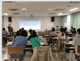
市内15拠点合同の 全体研修会