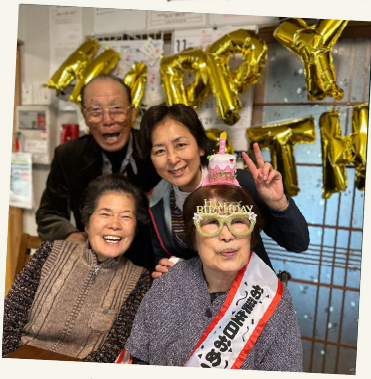
ご家族も一緒に 誕生日パーティ