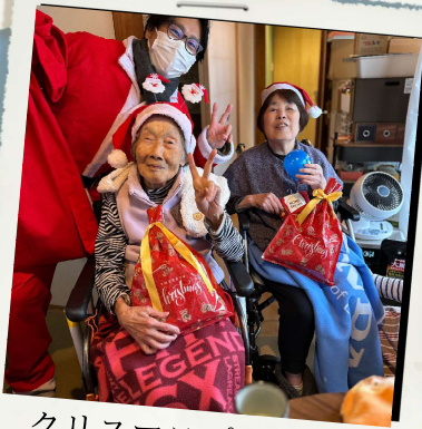
クリスマスプレゼント を持ってサンタさんが 来てくれました