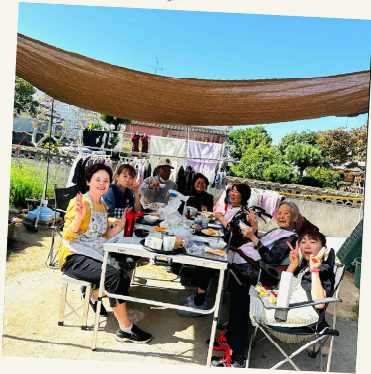
お庭でランチ♪ 風が気持ちいいね