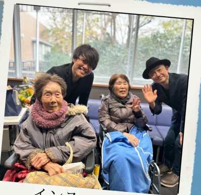
インサートの コンサートへ 行ってきました