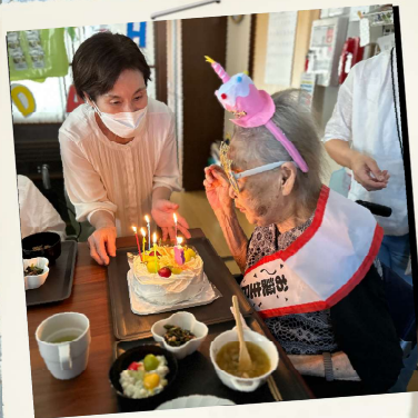
誕生日ケーキの キャンドルは一吹きで 消えました！