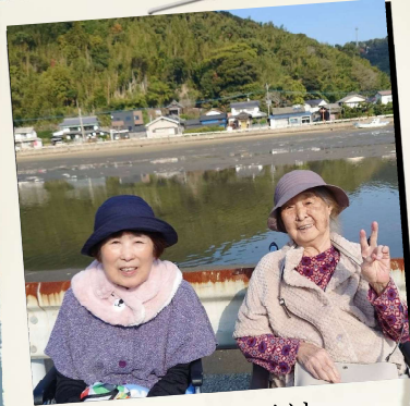
天気がいい日は 近所へ散歩