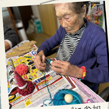
ワークショップに参加 毛糸でノームを 作りました