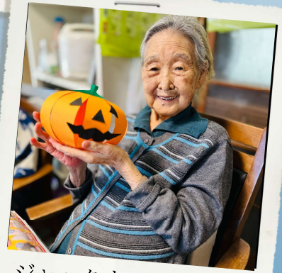
ジャックオランタンも 上手にできたでしょ！