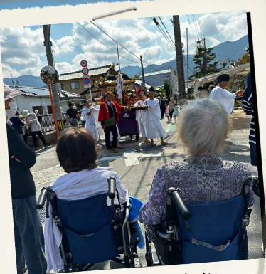
深江神社の神幸祭 しずくの近くを 行列が通ります