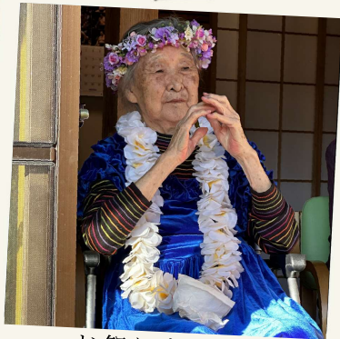
お祭り広場で 一緒にフラダンス 昔を思い出しました