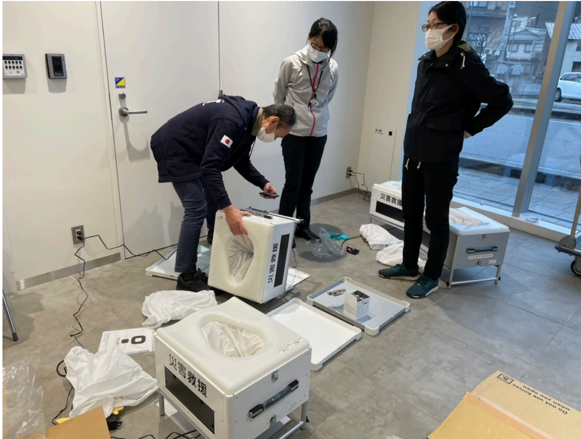
ラップポンの設置