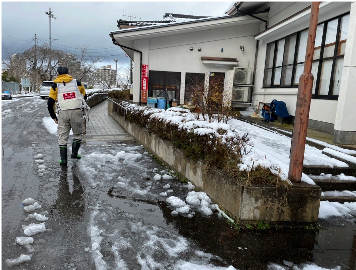
悪天候下での活動