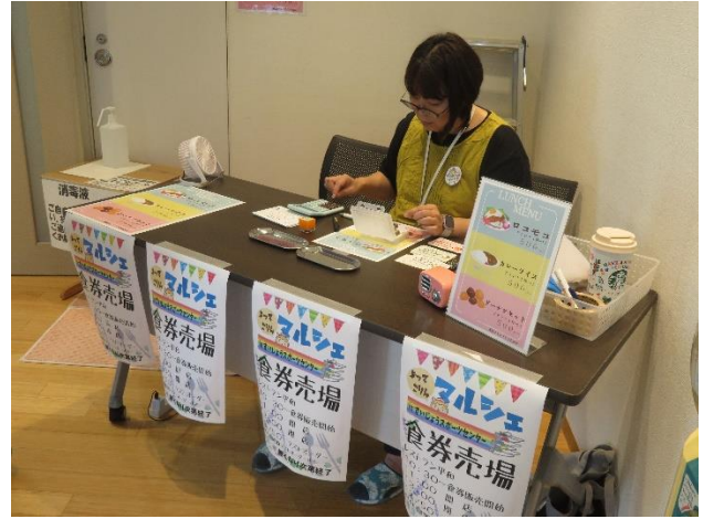
チャリーティーカフェ受付