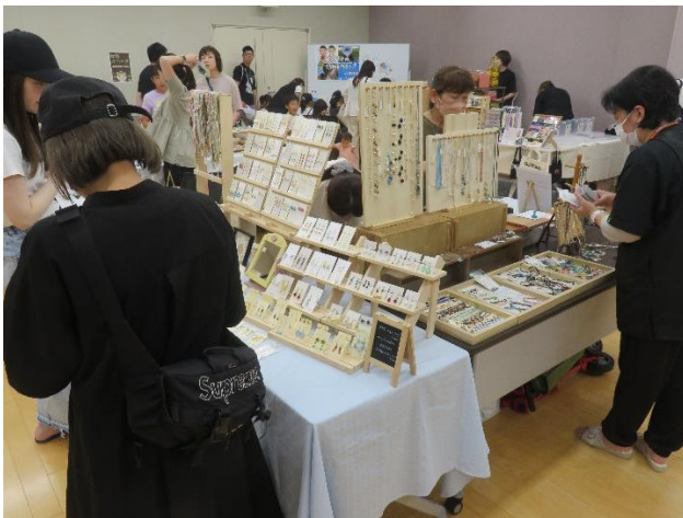
ハンドメイド作家さんが作った作品販売