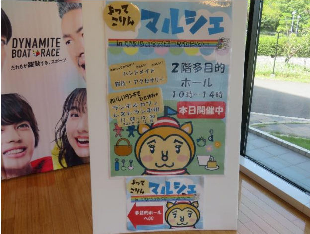
「よってこりんマルシェ」開催しました