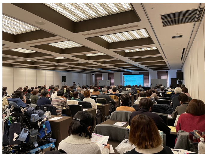
「命を受け止めるまちづくり」