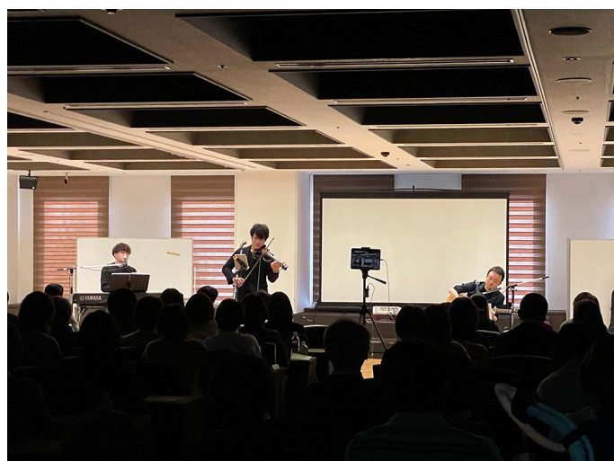
「あなたのところに寄り添うことば」