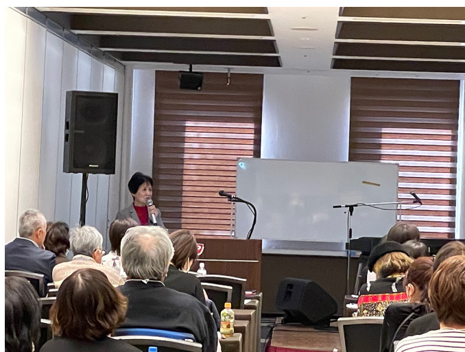
「ホームホスピスの暮らし」