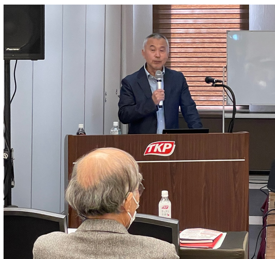
「はたけの家の暮らし」