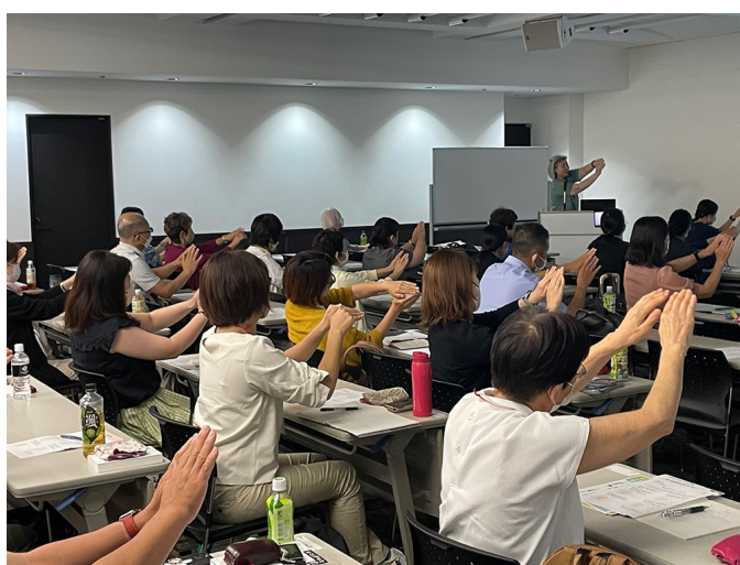
「タクティールケア」