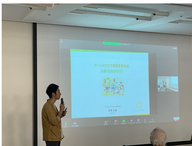
「広報・広告を学ぼう」