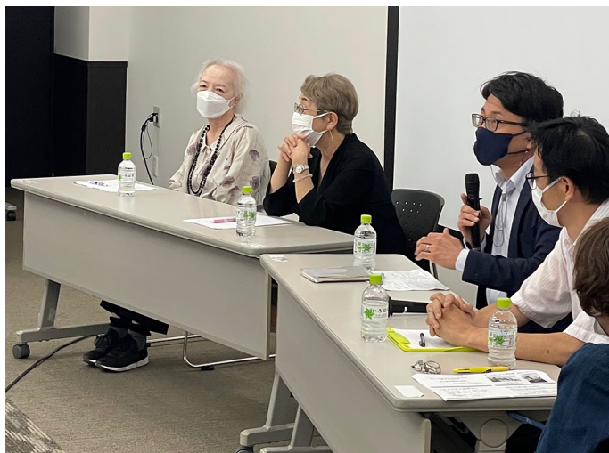
「チームづくり（シンポジウム）」