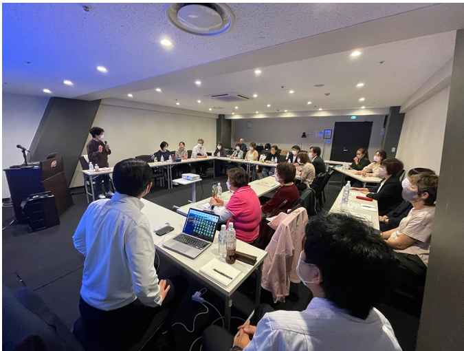
関東支部研修会（2023年10月20日）