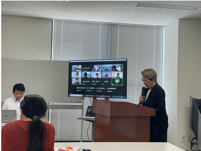
東日本支部研修会（2023年9月9日）