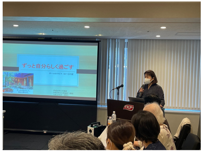
関東支部研修会「各ホームホスピスの取組」