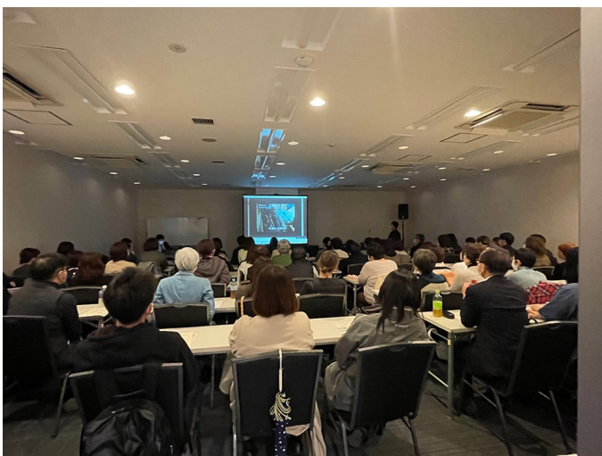
西日本支部研修会（2024年3月24日）