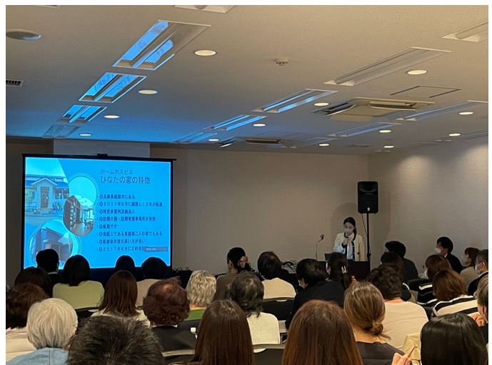
西日本支部研修会「一般向け講座」