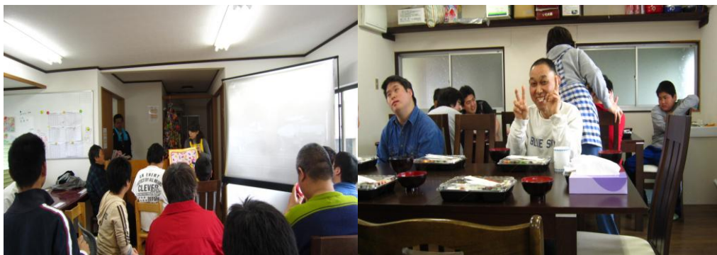
すずらんとかたつむりにて ご褒美に手品