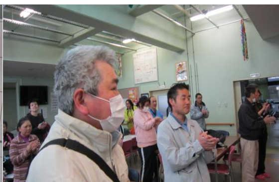
お礼の言葉を頂く