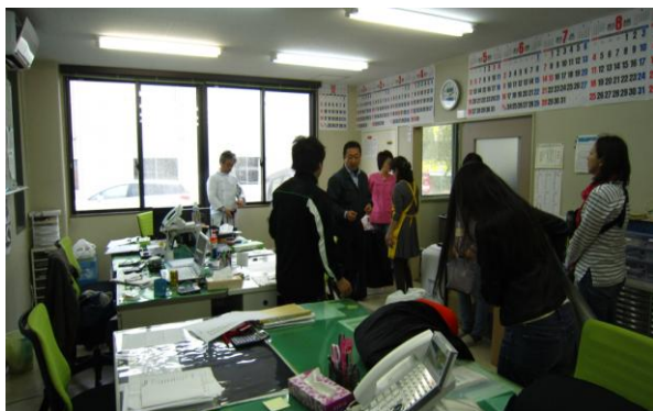
青松館にて打ち合わせ