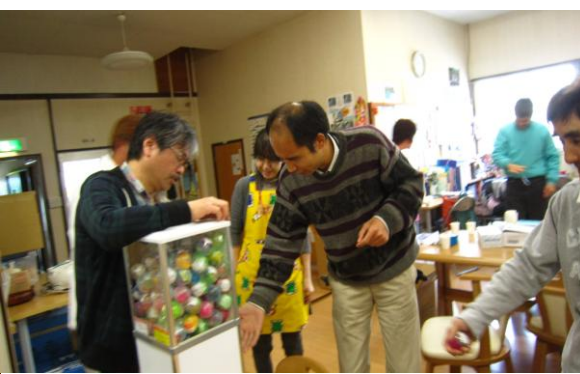
ご褒美のガチャポン