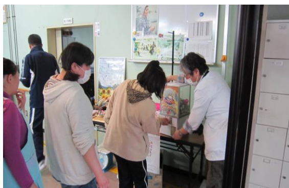
ご褒美のガチャポン