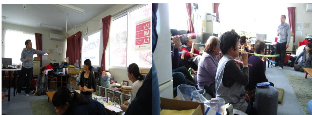
米崎小学校仮設住宅集会所にて 講話”一生自分のお口でたべよう”