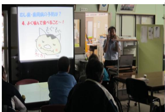
講話”一生自分のお口で”