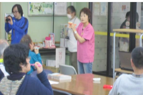
ブラッシング実地指導