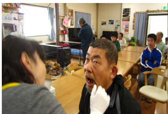
作業所きらりにて染め出し