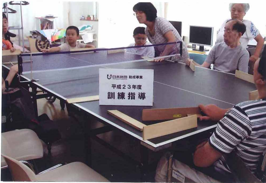
事業の実施状況写真