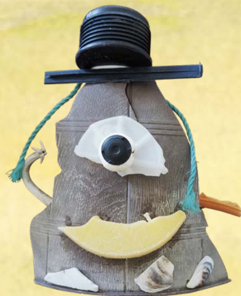
◆ Gomi taberun, dévoreur de déchets, 20 ans