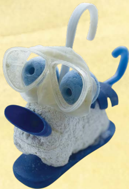
◆ Sandalian, 555 jaar ans