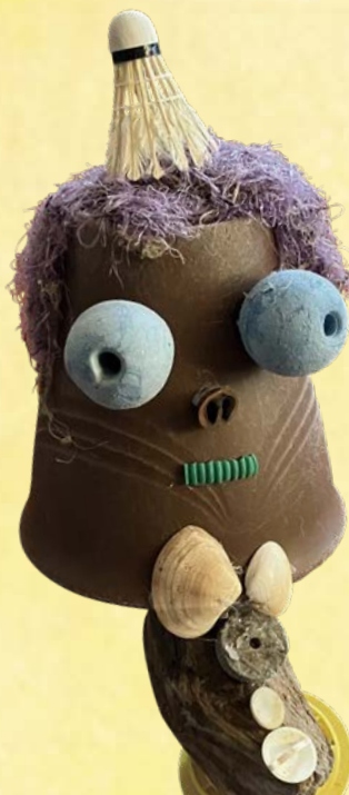
◆ Kadarn, parterre de fleurs, 1 065 ans