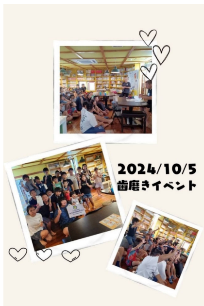
10月5日歯磨きイベント