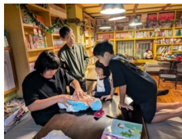
11月27日みんなの保健室