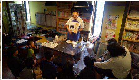
2月22日お仕事ハッピー号