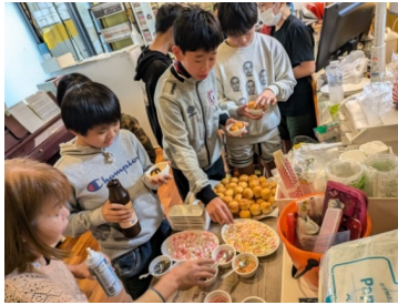
2月11日バレンタインチョコレート作り