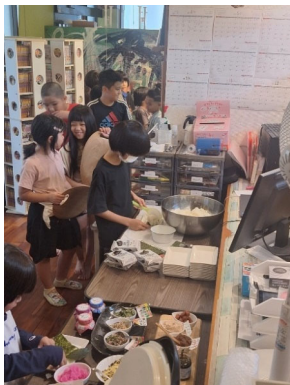
11月16日おにぎりイベント