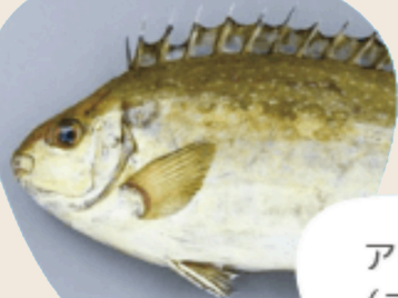
アイゴ (アイ・ バリ)

今年で2年目となる「海のごちそう地域モデルinみえ熊野」キックオフイベント開催 全国的に問題となっている、海の森が減少する「磯焼け」。その原因の一つとされている 海藻を食べる魚（植食性魚類）を美味しくいただきながら、海の課題について皆で一緒に考え、 それぞれがアクションを起こしていくためのプロジェクトです。