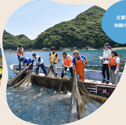
定置網漁 体験の様子

これらの魚たちは、 あまり美味しくないイメージがあり、 漁師さんも好んで水揚げせず、 一般的に流通する機会も少ないのが現状です。