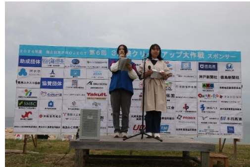
左 紀淡海峡：洲本高校社会部・洲本実業高校ユネスコクラブによる司会進行 右 明石海峡：A I E国際高校ボランティア部による司会進行