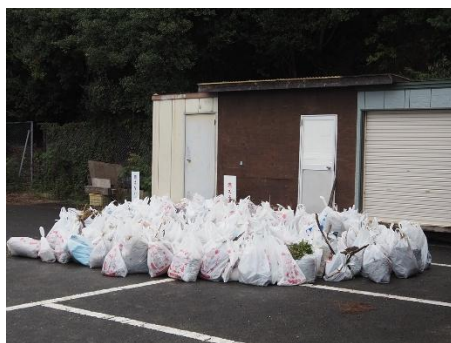
淡路島鳴門海峡 阿万