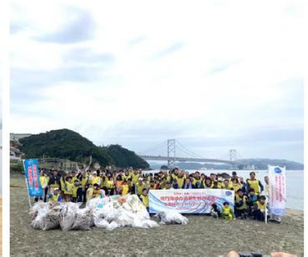
鳴門海峡 鳴門市鳴門町 千鳥ヶ浜海岸