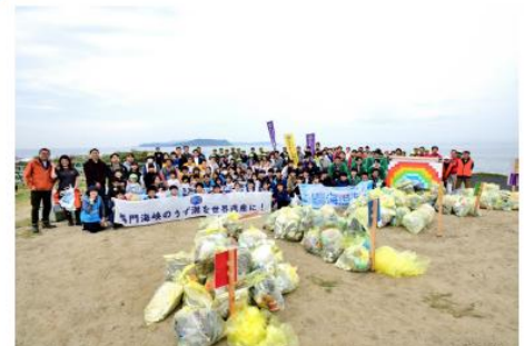
紀淡海峡 洲本市由良町 生石海岸

2024年度は2200名の方々にご参加いただき、10月26日（土）に無事終了しました！！