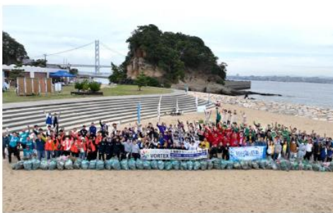
明石海峡 淡路市岩屋 田ノ代海岸