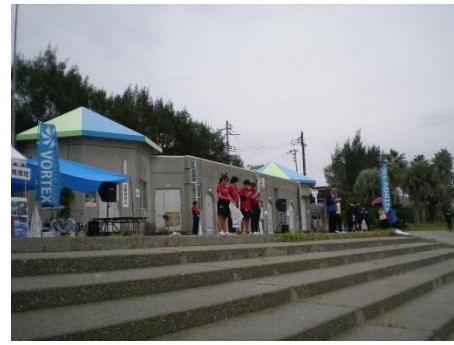
左 淡路島鳴門海峡 伊毘：神戸大学情報知能工学科生・吉備国際大学海洋水産生物学科生による司会進行 右 淡路島鳴門海峡 阿万：蒼開高校アスリート進学コースによる司会進行