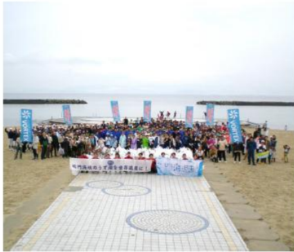
鳴門海峡 南あわじ市阿万西町 阿万海岸