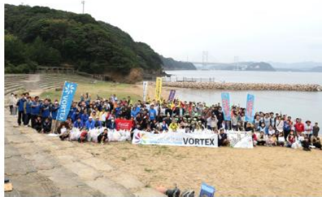
鳴門海峡 南あわじ市阿那賀 伊毘海岸