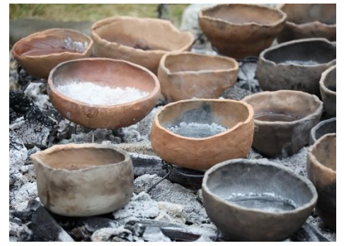
田ノ代海岸：A I E国際高校ボランティア部の協力、テレビ東京「みんなのあおいろ」のTV取材