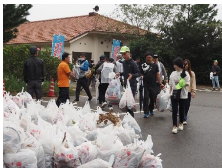
淡路島鳴門海峡 伊弉