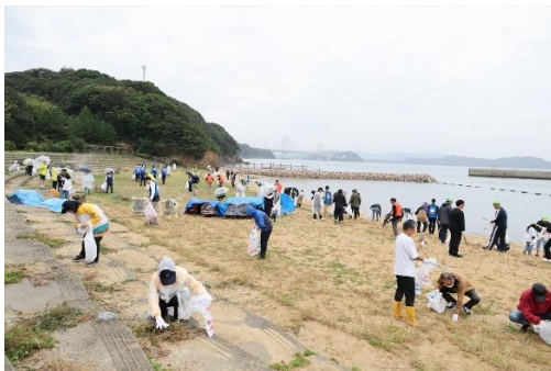
淡路島鳴門海峡 伊毘