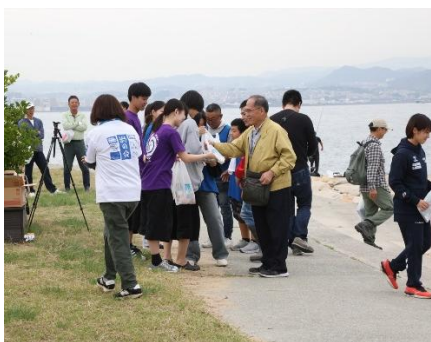
3海峡：J E A Nごみ調査