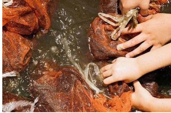
令和6年11月23日 苗床づくり・直まき