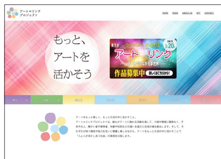
コミュニティサイト

掲載された作品への投票機能として「いいね」ボタンを採用。コメント機能も実装していますが、今回のコンテストでは管理上の課題もあり使用しませんでした。 ※1