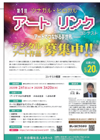
コンテスト告知チラシ