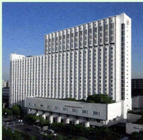
シェラトン都ホテル大阪